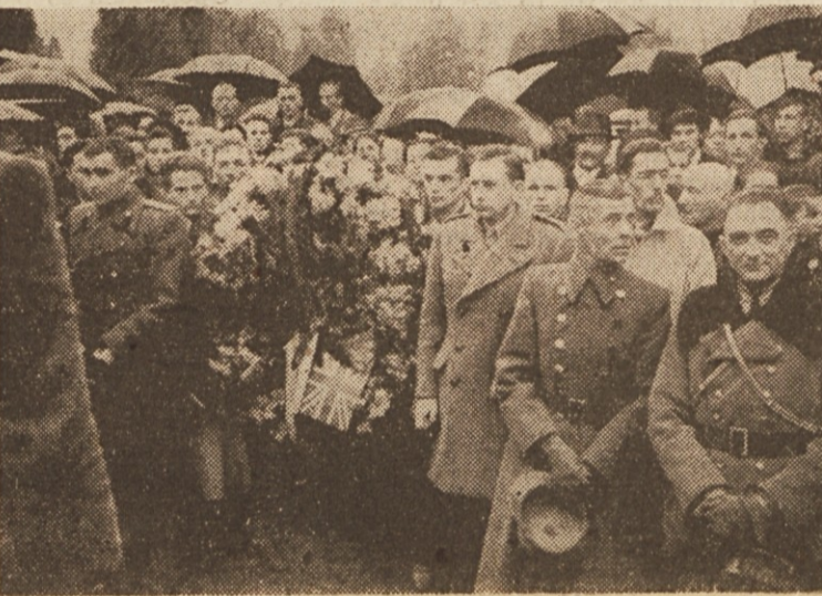
Britansko zastopstvo pred položitvijo venca

Grob v št. Rupertu pri Velikovcu, kjer počiva 84 borcev za svobodo naj nam bi postal simbol miru in sožitja. Ideja skupnosti in neuklonljivosti naj bi navdala tudi nas in nas vodila lepšim in mirnejšim časom naproti. Zaživimo enkrat v miru, ki ga ne bodo kalile strankarske in politične spletke, ne nacionalna prenapetost. Pokažimo, da smo potomci junakov in neustrašenih borcev za pravice človeštva, in da smo pripravljene rajši umreti, kakor pa priznati krivico in ji služiti. Navdaja nas naj samo ena želja, ki nam jo je naš pesnik Prešeren tako lepo izrazil: »Žive naj vsi narodi, ki hrepene dočakat dan, da koder sonce hodi, prepri iz sveta bo pregnan!«