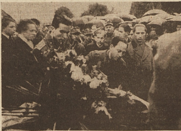
Jugoslovansko zastopstvo polaga venec

obrodilo naše delo. Kot smo bili med prvimi v borbi proti tlačiteljem človeštva, če ne celo prvi, tako bodimo tudi prvi, ko gradimo novo pot bodočnosti. Prej nas ni bilo strah žrtve; se jih bomo morda danes bali? S skupnim delom in pozitivno kritiko bomo delali tako dolgo, da bo vsakemu izmed nas zagotovljeno človeka dostojno življenje. Pri tem pa moramo biti enotni in složni, ker »sloga jači, a nesloga tlači!« —š.