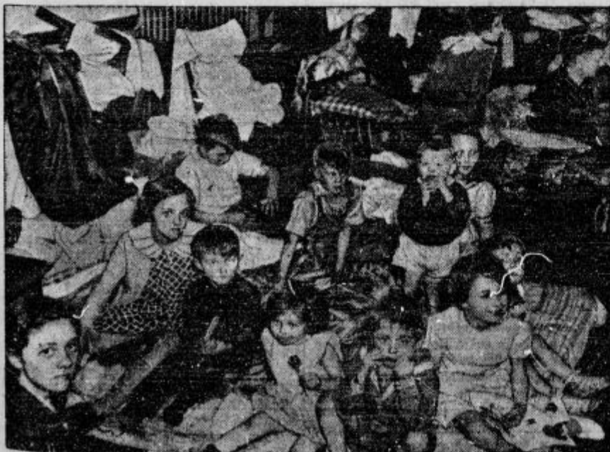
Poplave v Ameriki so uničile tisoče domov. Na sliki vidimo skupino otrok, ki so jih rešili pred valovi.

d Dva važna dodatka k finančnemu zakonu. Finančni odbor narodne skupščine je sklenil: Pooblašča se pravosodni minister, da s soglasjem finančnega ministra najame posojilo pri Drž. hipotekarni banki v višini 20 milij. Din, ta znesek izplača srbski pravoslavni patrijarhiji, kolikor je izdala za gradnjo poslopja za patri-