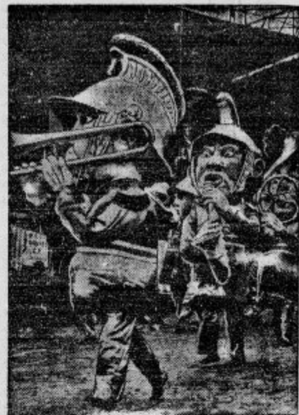
Pust je čas norosti. Ponekod ga praznujejo posebno slovesno. Na naši sliki vidimo pustno parado gasilcev v Nizzi.