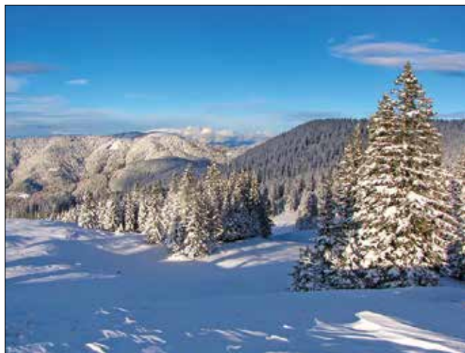
V Zgornji Savinjski dolini prevladujejo smrekove monokulture.

Seveda to nikakor ne pomeni, da gozdovi zaradi ujм niso prizadeti in ogroženi. Na najbolj poškodovanih predelih so močno zmanjšane njihove ekološke in socialne storitve ter seveda tudi proizvodne. Posebej za lastnike, ki jim je veter poškodoval znaten del gozda in lubadar »pojedel« večino smrek, je to velika gospodarska škoda. Kako se lotiti usmerjanja razvoja gozdov v spremenljivih klimatskih pogojih, bomo prikazali prihodnjč.