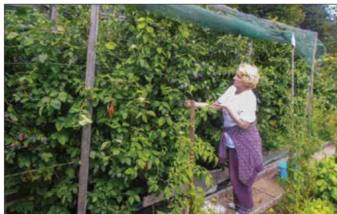
Borovnice, kakršnih ne vidiš vsak dan.