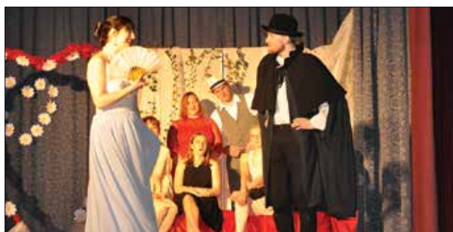
V predstavi Šmeksi Ljubezen je svoj prostor našla tudi zgodba prelepe Urške, ki s Povodnim možem potone v valovih Ljubljance.

zgodbi srečen konec, a vse zgodbe zaljubljenih niso bile takšne. Lju-