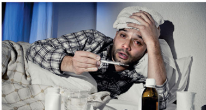
Le kje sem dobil gripo, saj nikamor ne grem? Aja, najbrž v vrsti za cepljenje proti gripi.