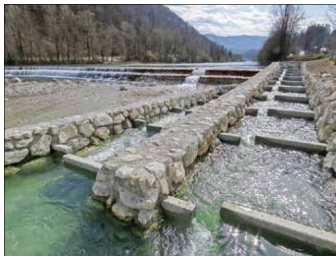
Zaradi tehnične zahtevnosti in potrebne natančnosti je bila izvedba steze zamudna, trajala je okoli tri mesece.

dal: »Investitor del je Direkcija RS za vode. Celoten projekt je zajemal obnovo Delejevega jezusa, to je kompletno novo podenje iz macesnovih poloblic in lokalno ojačanje temeljenja jezusa. V sklopu tega se je izvedla ribja steza oziroma uradno steza za prehod vodnih organizmov.