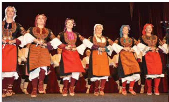
Plesalci Kulturno umetniškega društva Mladost so navdušili.

Plesalci Kulturno umetniškega društva Mladost in Srpskega kulturnega društva Maribor se zavzemajo za ohranjanje srbske tradicije, kulture in jezika in tako pri nas kot v tujini navdušujejo občinstvo z odličnimi nastopi. Z indijskimi in orientalskimi oziroma trebušnimi plesi so se predstavili člani Plesnega društva Salam Ghazeea, odple-