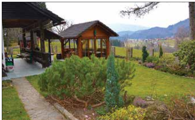
Verbučeva poletje preživljata zunaj, najraje v družbi prijateljev.

Okrog hiše so prijetno razporejene gredice, kjer so že odcveteli zvončki in telohi. Nekatere grmovnice so cvetele pozimi, druge počasi postajajo zelene. Zeleno je tudi okrog ribnika, kjer je Marjanin najljubši prostor. Tam rada pose-