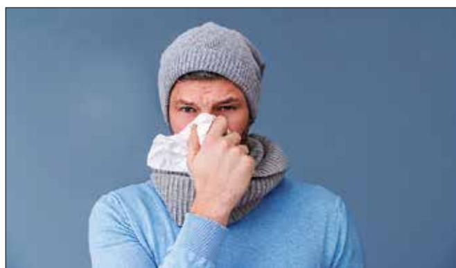
Čeprav so se nizke temperature vrnile, se število bolnikov z gripi podobno boleznijo zmanjšuje.

Kapljično prenosljive nalezljive bolezni so predstavljale 83,2 odstotka vseh prijavljenih bolezni.