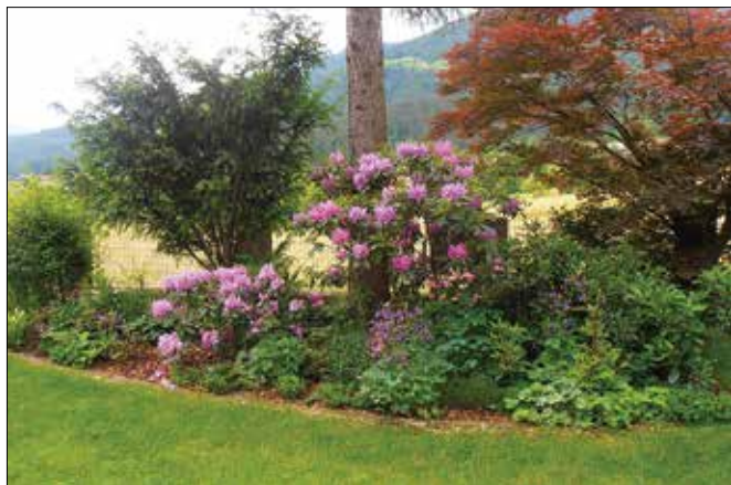
Domovanju delajo senco drevesa, krasijo ga grmovnice.