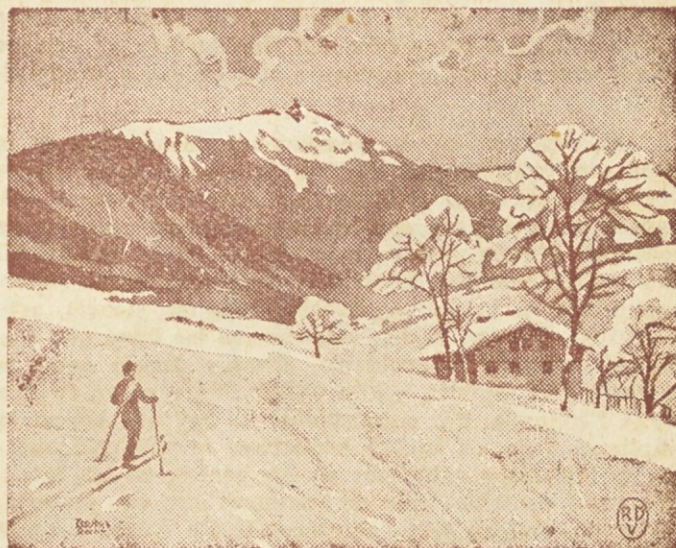
Un panorama de Navidad en Eslovenia. Božična slika iz Slovenije.

Para comprender el marxismo hay que conocer el idealismo de Hegel (1770-1831) que fué un filósofo alemán, Marx (1818-1883) y Engels (1820-1895) quedaron fascinados por la filosofía de Hegel. Según él, todas las cosas existentes, o mejor, lo que nos rodea aparentemente, no existe realmente tal como lo percibimos, sino que es tan solo un reflejo de la idea, de lo espiritual, que tiene existencia absoluta. Para Hegel lo principal es la idea. Marx y Engels invirtieron la teoría de Hegel. Para ellos es lo primero la materia; el pensamiento, la idea, la conciencia, son productos superiores en la evolución de la materia. No hay, según ellos, al principio ningún espíritu creador, sino que es la ma-