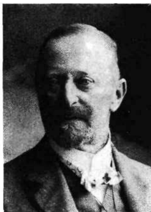
Leon graf Auersperg (1844–1915)