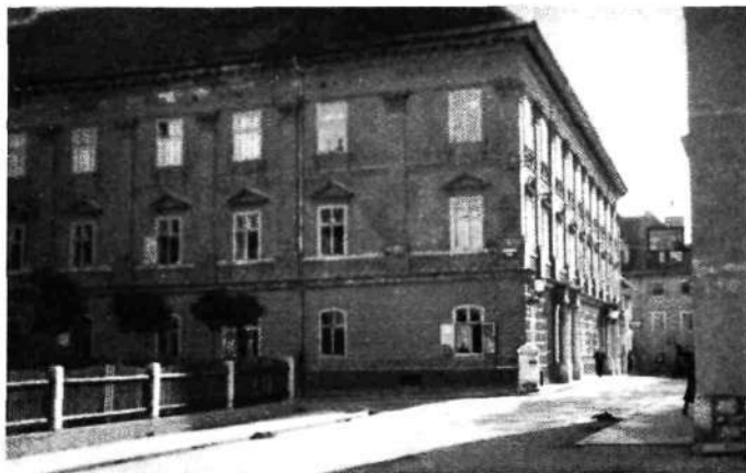
Mestni muzej v Ljubljani. Bivši Auerspergov, Grofovski dvorec. Pogled iz Gosposke ulice proti jugu