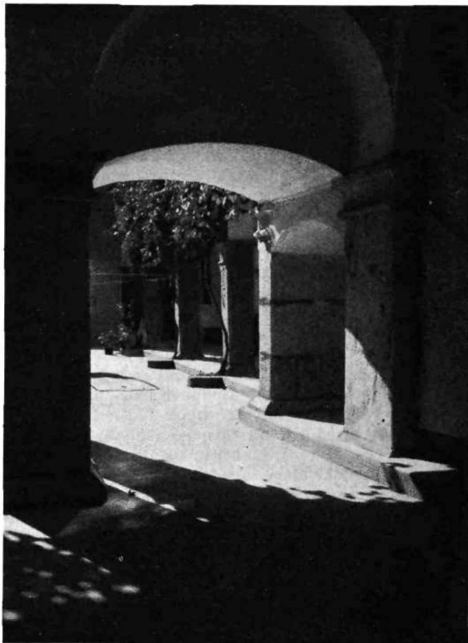
Arkade na dvorišču. Stopi in arkade v veži, pritličju in na dvorišču