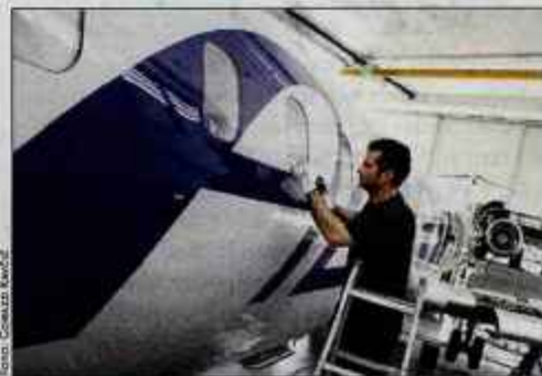
Adriini mehaniki na leto do najmanjše podrobnosti pregledajo približno sto letal.