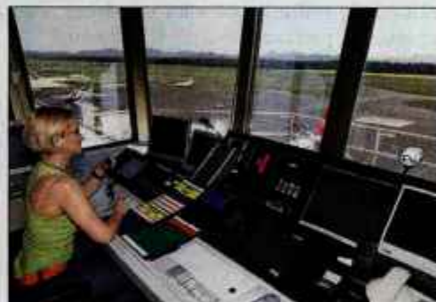
Kontrolorji imajo na brniškem letališču najlepší razgled in najzahtevnejše delo.