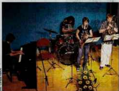
Svež veter na škofjeloškem glasbenem področju - Jazz je kul kvartet. Na petkovem koncertu je doživel svoj debi.