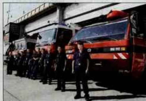
Letalski gasilci so v pripravljenosti 24 ur na dan, vse dni v letu.