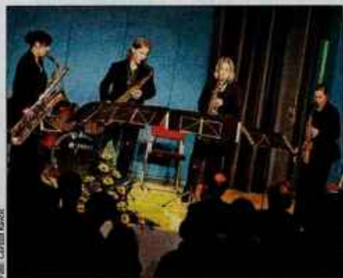
Navdušil je tudi kvartet saksofonov Saxadon/na iz Glasbene šole Freising.