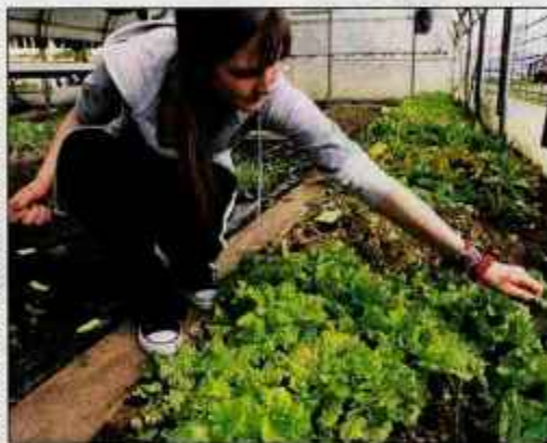
V ekološkem nasadu 28 sort solat

loška živila pot do zdravja? poudarjala, da si potrošniki vse bolj želijo varno hrano brez dodanih sintetičnih snovi. Živahno je bilo tudi na ekološki tržnici, tam so poleg ekoloških solat in druge sezonske zelenjave ponujali tudi ekološka semena in sa-