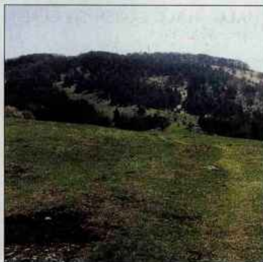
Travniki del, ki vas bo kljub vetru pošteno spotil.