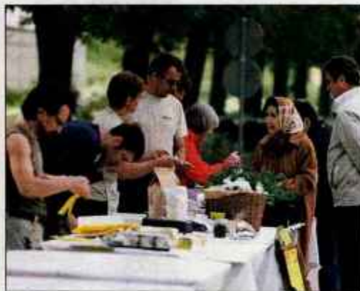
Na ekološki tržnici

center Nalko in semenarska hiša Rein Saat iz Avstrije, je bil v petek v biotehniškem centru Dan eko solat. Kot so povedali priveditelji, so "dan" namenili vsem, ki se ljubiteljsko ali poklicno ukvarjajo z ekološkim vrtnarstvom in pripravo hrane. Potrošnikom so glasno in jasno povedali, da je ekološka hrana, pridelana oz. predelana v domačem kraju, kakovostna in