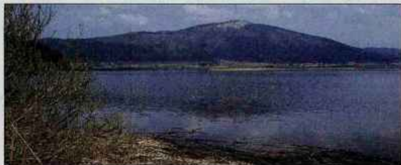
Se res na Slivnici zbirajo coprnice?

Nadmorska višina: 1114 m Višinska razlika: 550 m Trajanje: 2 uri in 30 minut Zahtevnost: ★★★★★