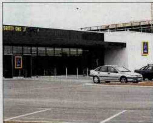
V četrtek bo Hofer v Kranju odprl prodajalno, konec julija pa tudi v Škofji Loki.

Za kupljene izdelke zagotavljajo tudi t. i. garancijo kakovosti, kar pomeni, da kupci izdelke lahko vrnejo v prodajalno, če z njimi niso zadovoljni. Na vprašanje Gorenjskega glasa o nadaljnjih investicijah v času finančno-gospodarske krize, v Hoferju odgovarjajo: "Odprijetih novih