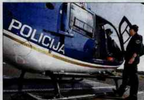
Policijski helikopter lahko v nujnih primerih vzleti v petih minutah.