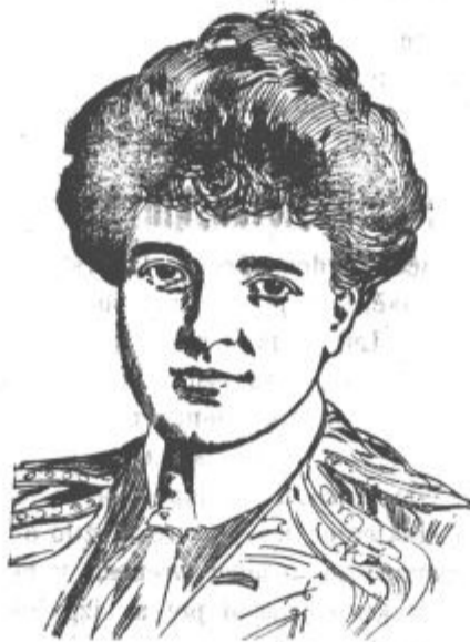
Portugalska kraljica-vdova Amalija.