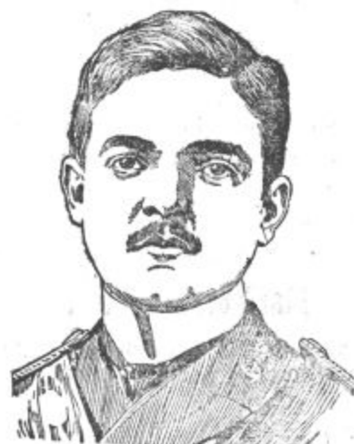
Bivži portugalski kralj Manuel II.