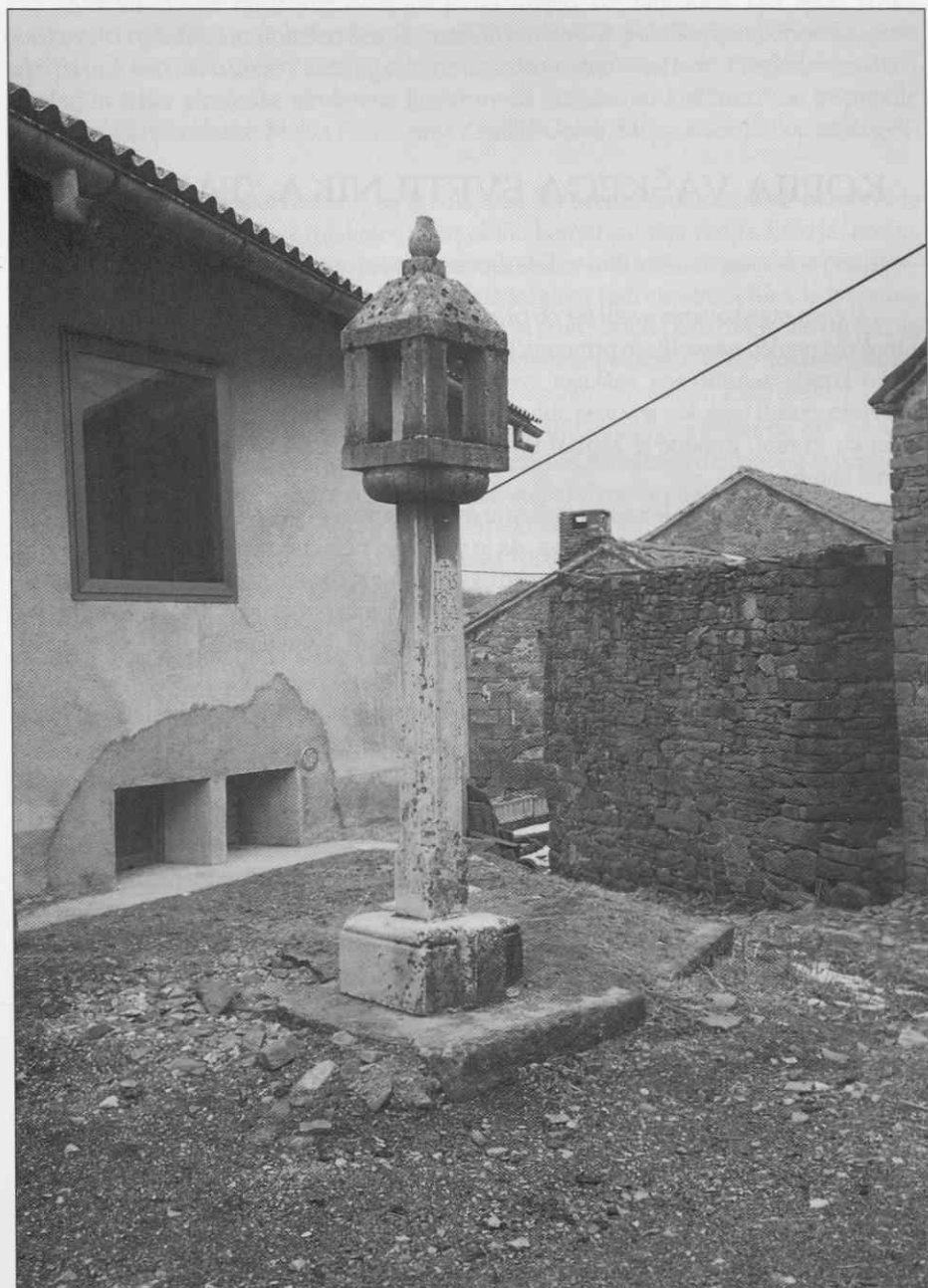
Vaški svetilnik na trgu v vasi Suhorje.

Za ta podvig smo dobili prijaznega sponzorja, podjetje Javna razsvetljava. To se je odločilo za sponzoriranje na podlagi ponudbe, da eno kopijo izdelamo zanj. Po dogovoru s Krajevno skupnostjo Suhorje in po ogledu na terenu, skupaj s predstavnikom