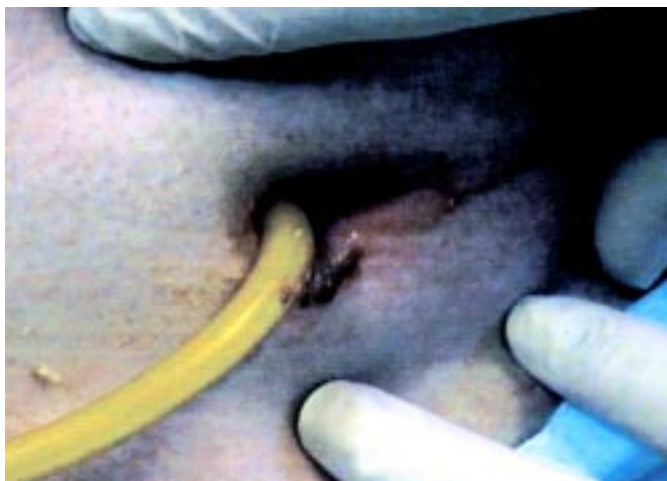
Sl. 2. Glivična okužba izstopišča PEG na zunanji strani trebušne stene.

Figure 1b. Normal position of the feeding tube inserted via PEG in younger patient after serious head injury.