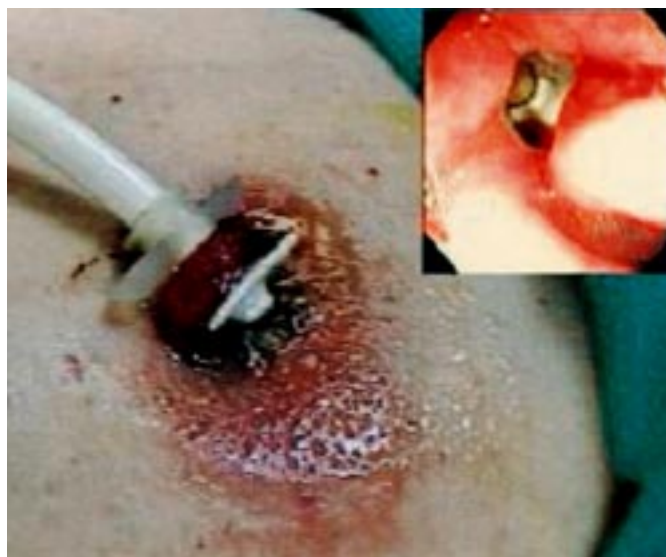
Sl. 3. Bolnik z v trebušno steno vraščanim lijakom PEG hranilne sonde ( buried bumper sindrom ). Večja slika prikazuje defekt po poskusu izvleka hranilne sonde, manjša slika pa začetni endoskopski izgled zapleta (prirejeno po 4).

Figure 3. External (large figure) and endoscopic (small picture) views of a patient with buried bumper syndrome (adapted from 4).