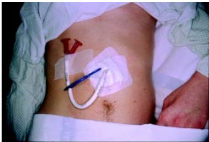
Sl. 1b. Normalen položaj hranilne sonde, speljane skozi perkutano endoskopsko gastrostomo pri mlajšem bolniku po težji poškodbi glave.

Figure 1b. Normal position of the feeding tube inserted via PEG in younger patient after serious head injury.