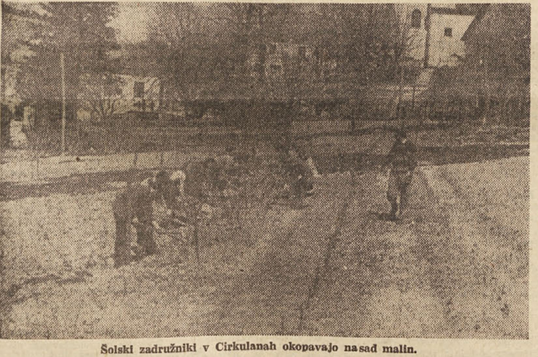
Solski združniki v Cirkulanah okopavajo nasad malin.

Kmetijske zadruge naj omogočijo šolski zadrugi ogled zadružnih nasadov, skladišč, predelovalnih nasadov, kmetijskih posestev, ekonomij, strojnih remiz, Poskrbijo naj, da bodo dobile v upravljanje del zemlje, če ni šolskega vrta. Zadružne naj pomagajo otrokom s strokovnimi navodili in nasveti in naj poskrbijo, da se bodo uspešno izobraževali tudi v tej smeri. Predlagamo, da prevzamejo patronat nad šolsko zadrugo in ji stalno pomagajo pri delu. Kmetijske zadruge naj pomagajo šolskim odborom pri ustanavljanju šolskih zadrug; poskrbijo naj za dobro sodelovanje med šolskim odborom, aktivom mladih združnikov, mladinsko organizacijo in drugim organizacijami. Tako sodelovanje bo omogočilo spremljanje učencev do končne osnovne šole ter do poznejšega vpisa v kmetijsko gospodarsko šolo in v aktiv mladih združnikov.