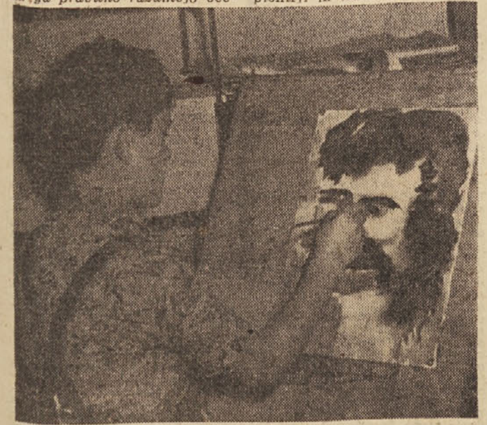
Mladi umetnik pri delu (Likovni krožek Pionirske knjižnice v Ljubljani)

kazala oblike likovne in tehnične vzgoje v teh zavodih. Na slavnostnem zborovanju bodo med drugim pregledali uspehe vzgojnega dela in dali priznanje najboljšim in najpožrtvovalnejšim izvenšolskim in predšolskim prosvetnim delavcem. V počastitev 40 - letnice ZKJ bodo vzgojni domovi vse leto tekmovali v aktivizaciji mladine za ideološki študij in delovne akcije, razen tega pa tudi v utrjevanju samoupravljanja mladine v domovih. Letos bodo izdal zbornik z aktualno problematiko predšolske in izvenšolske vzgoje, historični teh ustanov pri nas, pa tudi najboljše literarne prispevke gojencev.