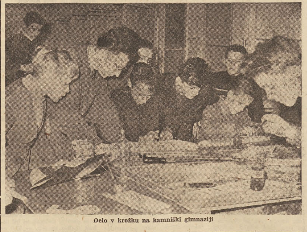
Delo v krožku na kamniški gimnaziji

Za učno in vzgojno osebje, ki v svojem delu za to šolsko leto ni pokazalo uspehov, kakršne bi moral pokazati, da bi dobilo splošno oceno »zadovoljuje«, ugotovi komisija z obrazložitvijo, da ni bilo dovolj elementov za ugodno oceno.