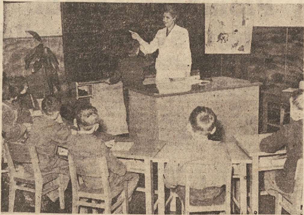
Pri pouku gluhih v Zavodu za gluho mladino v Ljubljani