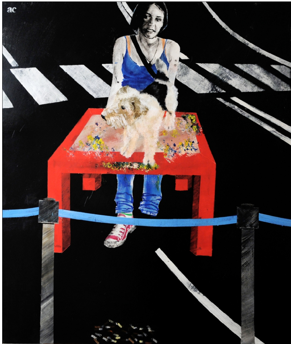
PORTRET A. C. TEMPERA NA PLATNU 100X120 CM, 2011