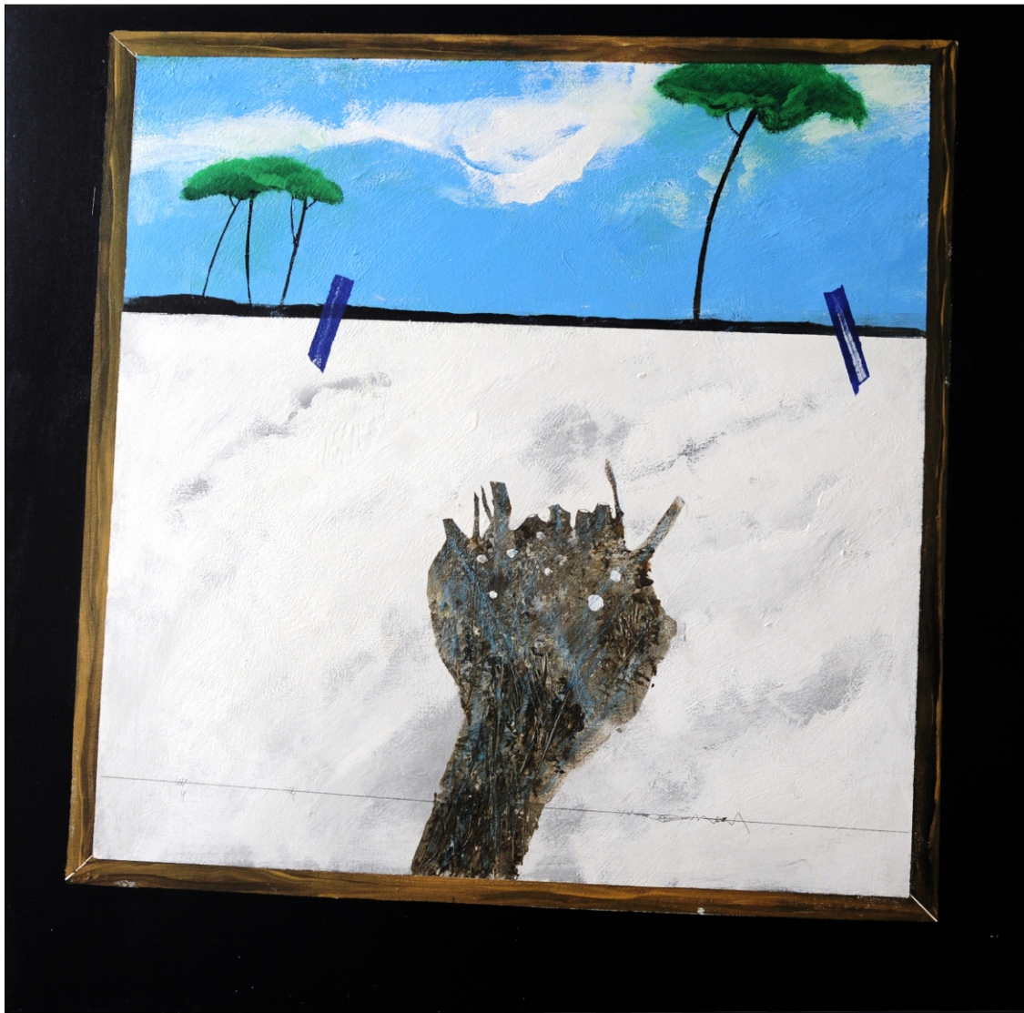
DVOJE V ENEM TEMPERA NA PLATNU 100X100 CM, 2011