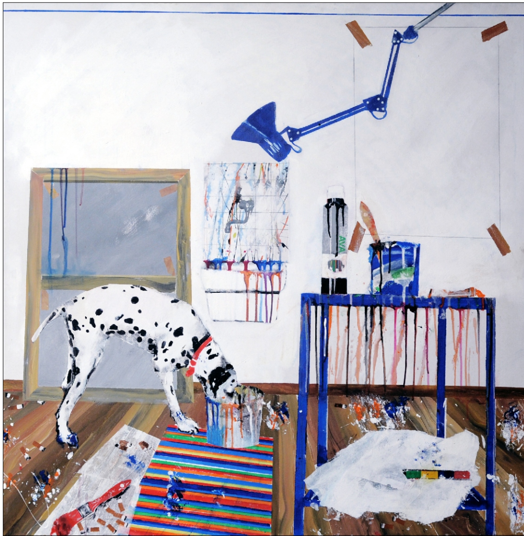
V ATELJEJU TEMPERA NA PLATNU 100X100 CM, 2010