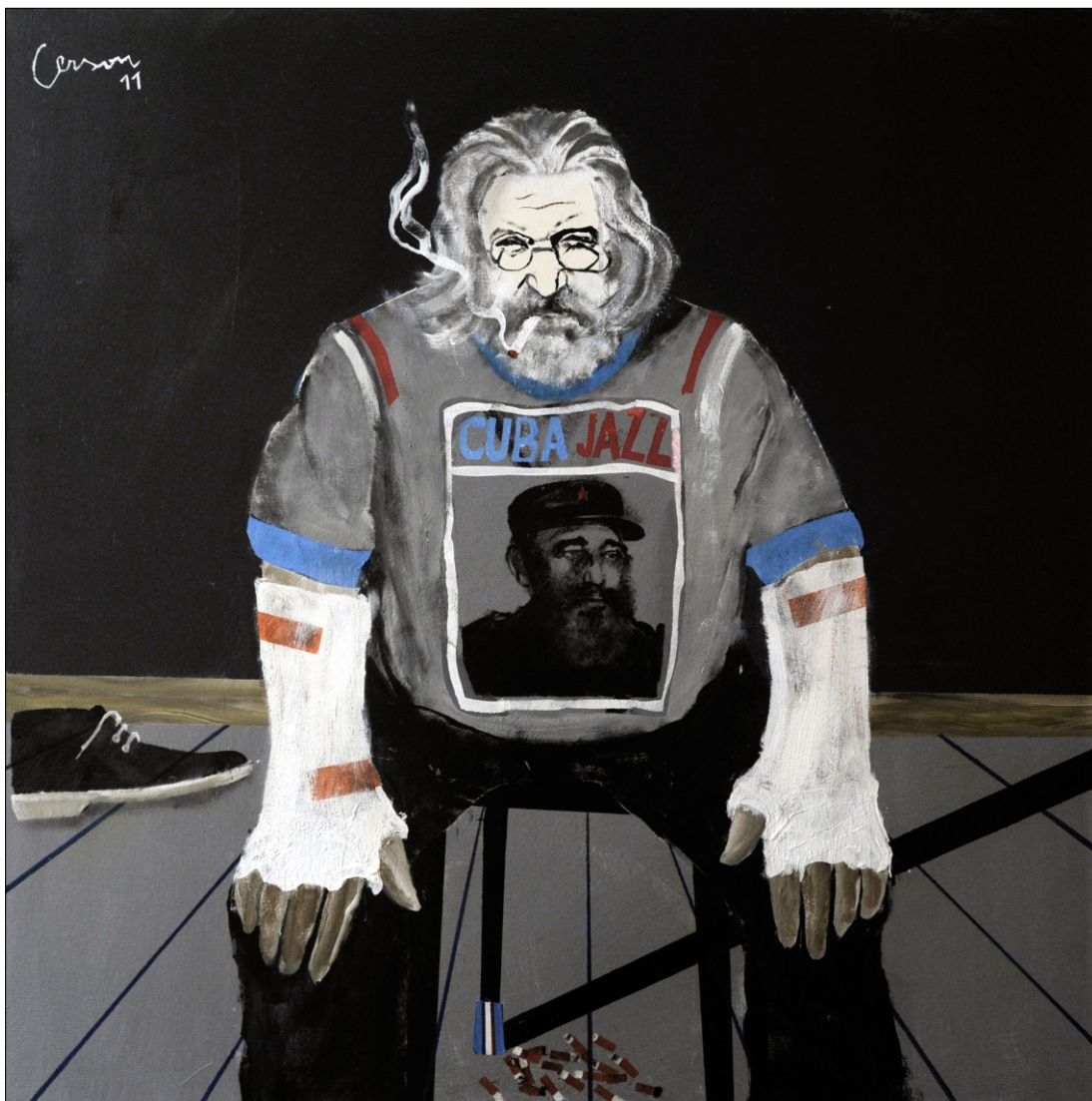
PORTRET COJANIZA TEMPERA NA PLATNU 100X100 CM, 2011