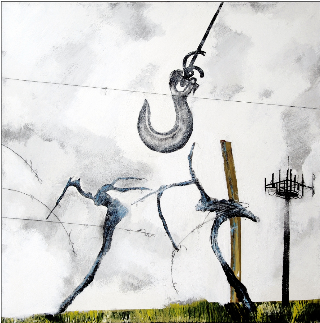
TRTE IN KLJUKA TEMPERA NA PLATNU 100X100 (2010)