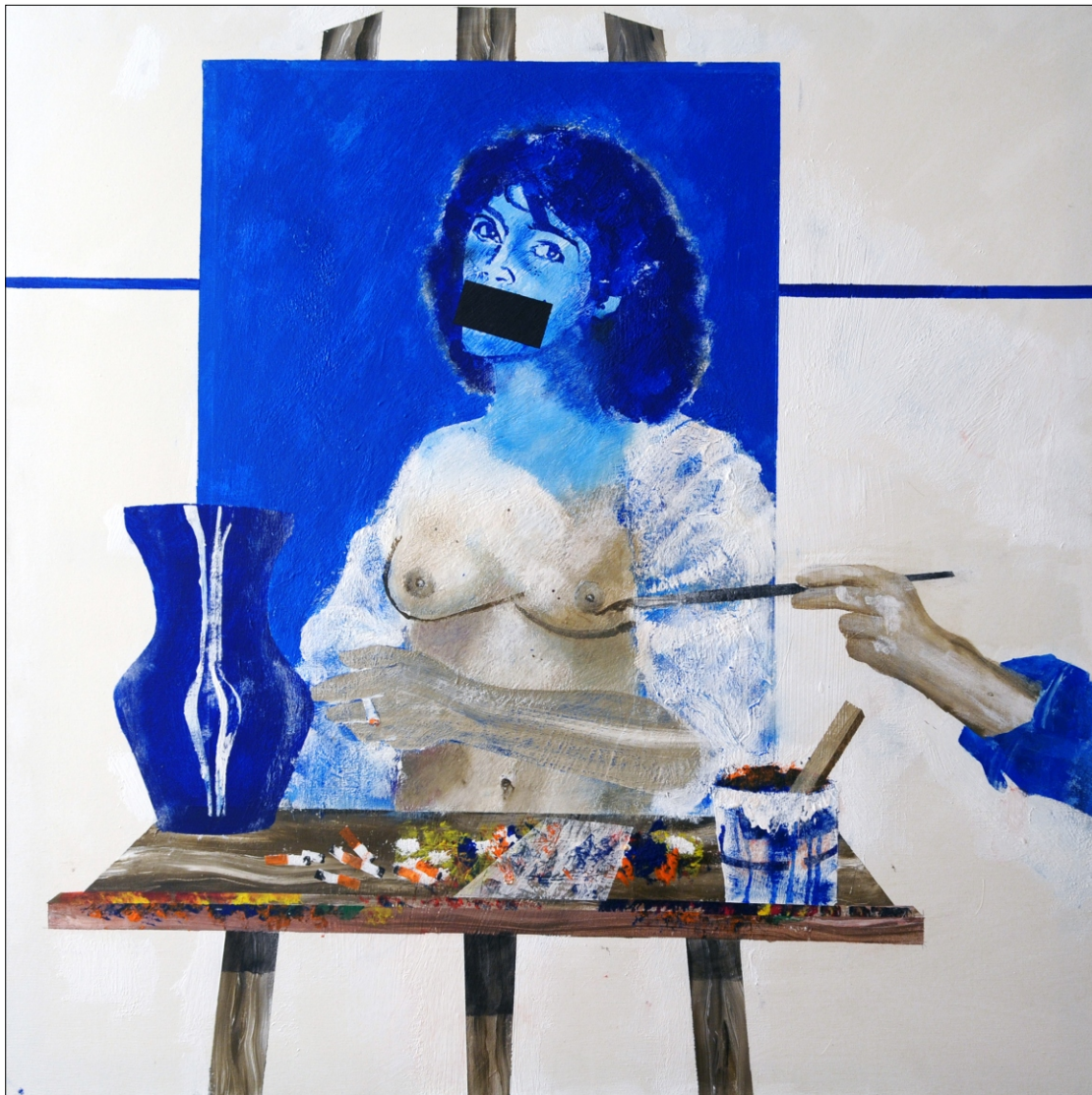
NA STOJALU TEMPERA NA PLATNU 100X100 CM, 2011