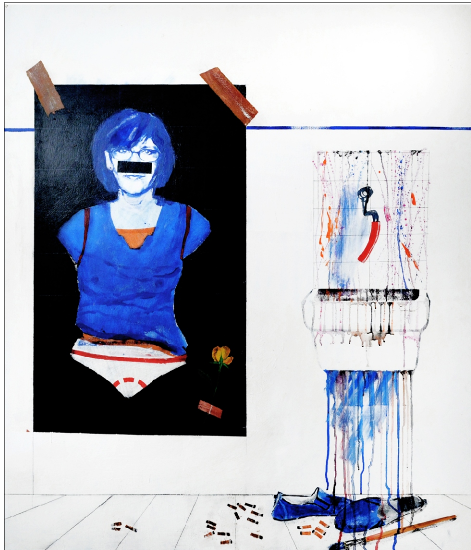
PORTRET IN UMIVALNIK TEMPERA NA PLATNU 100X120 CM, 2010