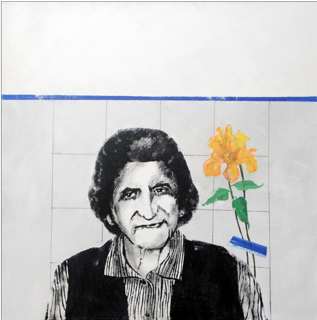
MOJA TETA TEMPERA NA PLATNU 60X60 CM, 2012