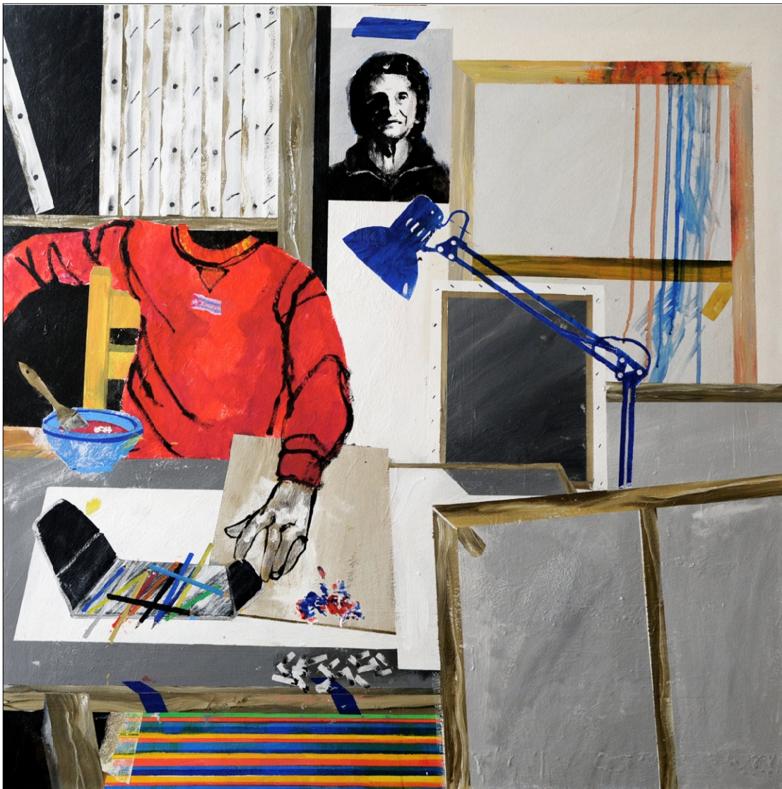
SLIKA, KI JO MORAM NAREDITI TEMPERA NA PLATNU 100X100 CM, 2011