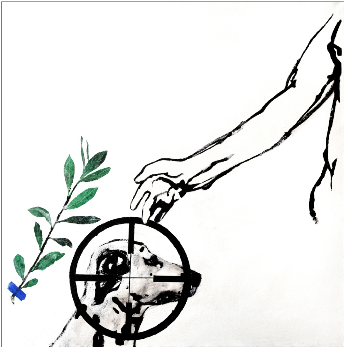
BREZ NASLOVA TEMPERA NA PLATNU 80X80 CM 2012