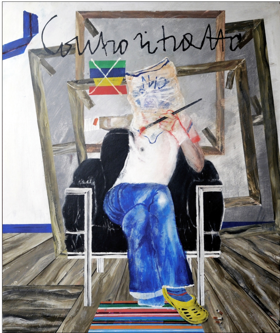
KONTRAPORTRET TEMPERA NA PLATNU 100X120 CM, 2011