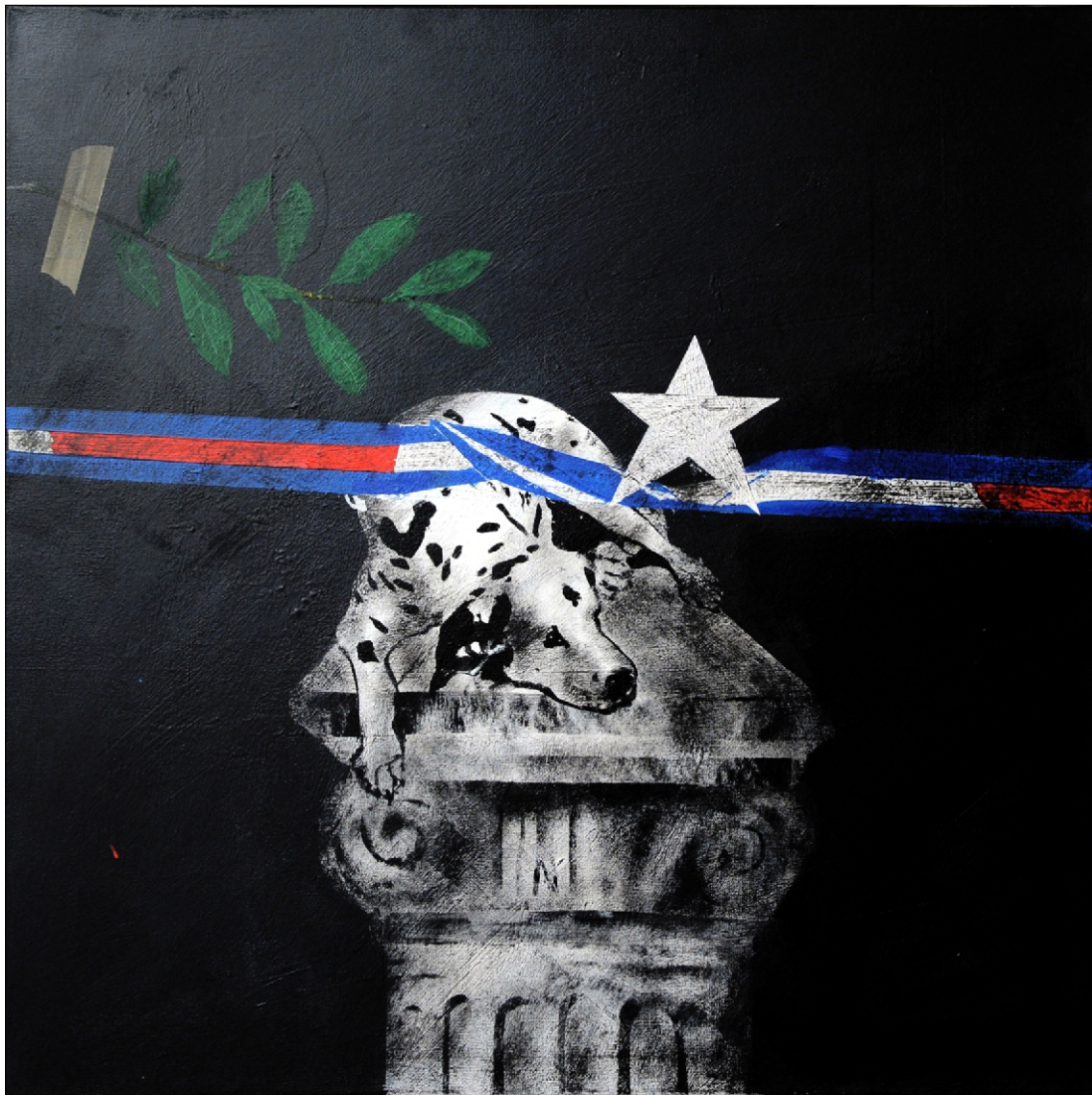
SPOMENIK TEMPERA NA PLATNU 80x80 CM, 2011