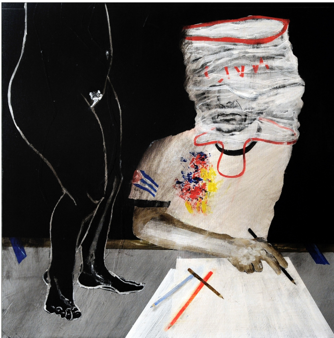
KONTRA PORTRET IN PORTRET ČRNA TEMPERA NA PLATNU, 80x80 CM, 2011