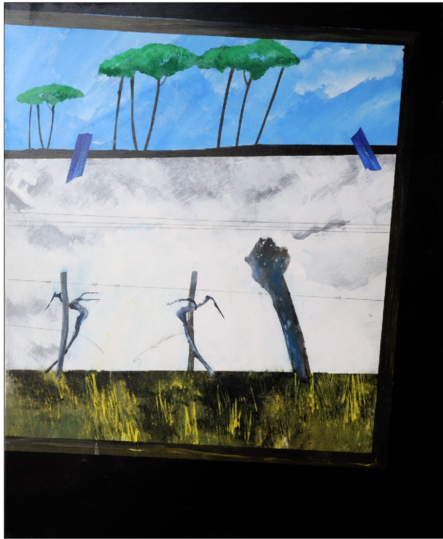
DVOJE V ENEM TEMPERA NA PLATNU 80X100 CM, 2011