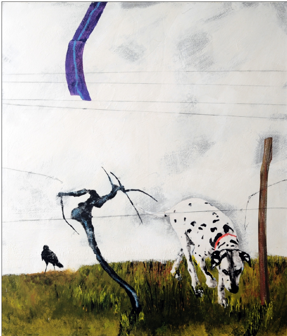
KROKAR, TRTE IN PES TEMPERA NA PLATNU CM 100X120 (2011)