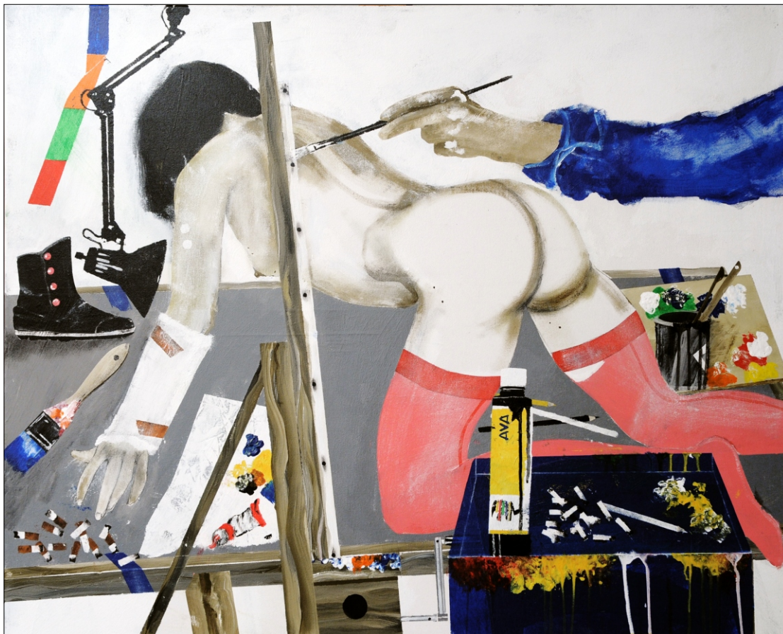
PORTRET TEMPERA NA PLATNU 80x100 CM, 2012