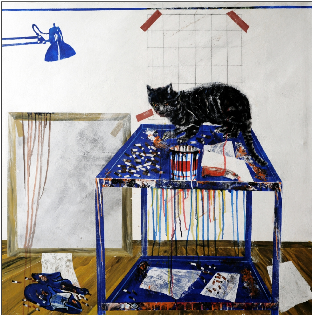
GLEJ, MAČKA TEMPERA NA PLATNU 100X100 CM, 2010