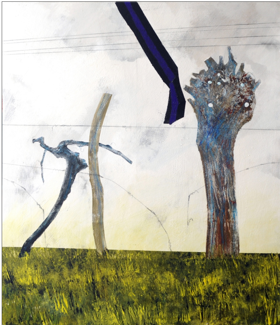
TRTE IN MURVA TEMPERA NA PLATNU 100X120 CM, 2011