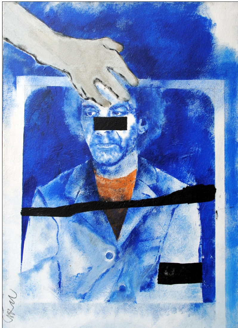
AVTOPORTRET TEMPERA NA PLATNU 50X70 CM, 2005