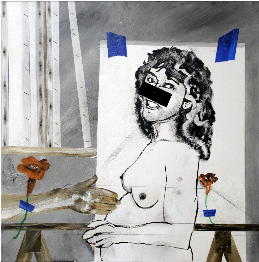
NA STOJALU TEMPERA NA PLATNU 70X70 CM, 2010