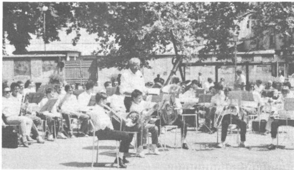
VIŠKI PIHALNI ORKESTER V I. SKUPINI