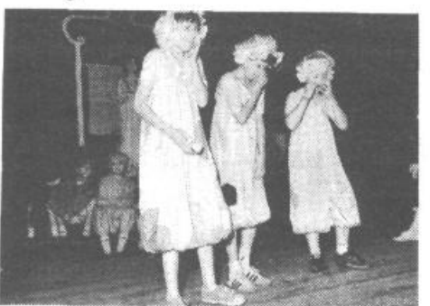
Prizor iz igrice Salon expon