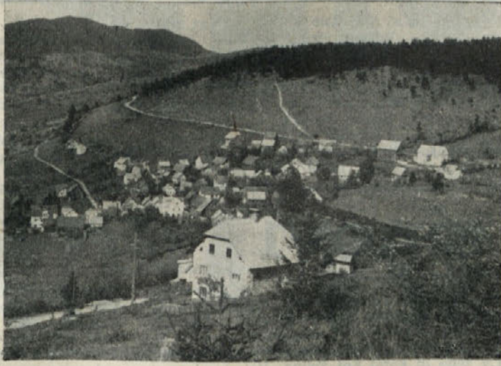
Pogled na Retje, veliko vas v Loškem potoku