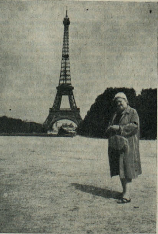
Pogled na Eifflov stolp v Parizu

Ker smo imeli v Parizu časa tri dni, smo si izdelali podrobnejši načrt in formalni manjši skupine po tem pač, kar je koga zanimalo. Nekateri so se poleg tega še prav mostsko vrgli na ogled nočnega življenja, ki je v tem mestu posebno razvito z vsemi odtenki in priokusmi. Valuta in denarno razmerje nam tu ni delalo težav. Imeli smo nove frankne in stare, ki so še vedno v obtoku. Cene v izložbah so označene vse v novih frankih. Tako si na starem bankovcu zatisnil dve ničli, kar ti je