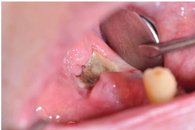
Slika 1: Razgaljena osteonekrotična kost v ustih bolnika, ki prejema antiresorptivna zdravila.

vijo z ARZ. Način jemanja, odmerek ter koncentracija ARZ so neposredno povezani s pojavnostjo MRONJ. Bolniki z osteoporozo običajno prejemajo ARZ v oralni obliki, nižjih odmerkih in širših intervalih (bolniki z nizkim tveganjem) kot onkološki bolniki (bolniki z visokim tveganjem). Pri slednjih je vnos običajno intravenski, in sicer v večjih odmerkih in pogostejših intervalih. Razpoložljivost terapije se tudi do 140-krat razlikuje med jemanjem skozi usta in vbrizgavanjem v veno. Tveganje poveča tudi sočasna kemoterapija ali jemanje kortikosteroidov (3).