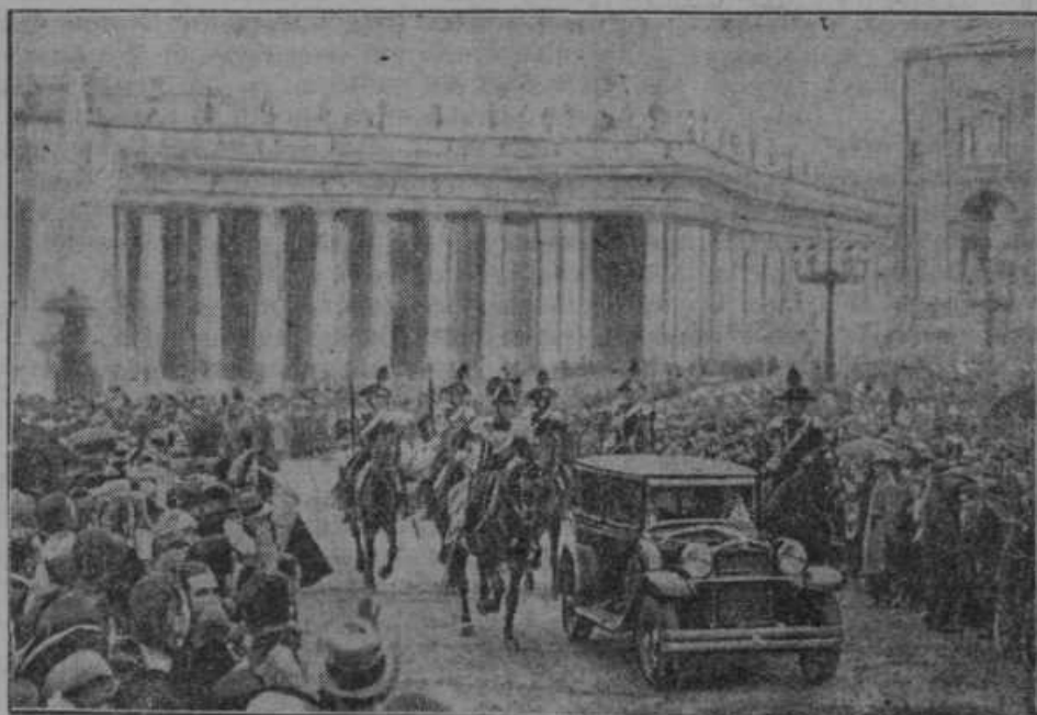
Mussolini na potu k papežu. — Desno: Vatikanska železnica bo de te dni otvorenja.

Samomor brez primere. Sinova cerkovnika na Bledu sta našla v otoški kapelici mrtvega mladega moškega. Samomorilec si je slekel pred smrtjo gornjo obleko, iz katere si je naredil na oltarju zglavje, kjer so ga tudi našli že zmrznjenega. Okolnosti so dognale, da je mladenič najprej izpil steklenico lizola, si prerezal žile na levi roki in si prizadjal še dva smrtonosna sunka v srce. Radi nesrečne ljubezni obupani je