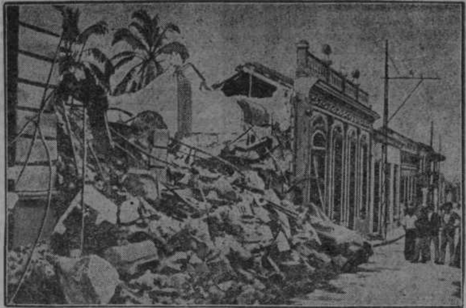
Slika potresa v mestu Santiago na otoku Kuba.