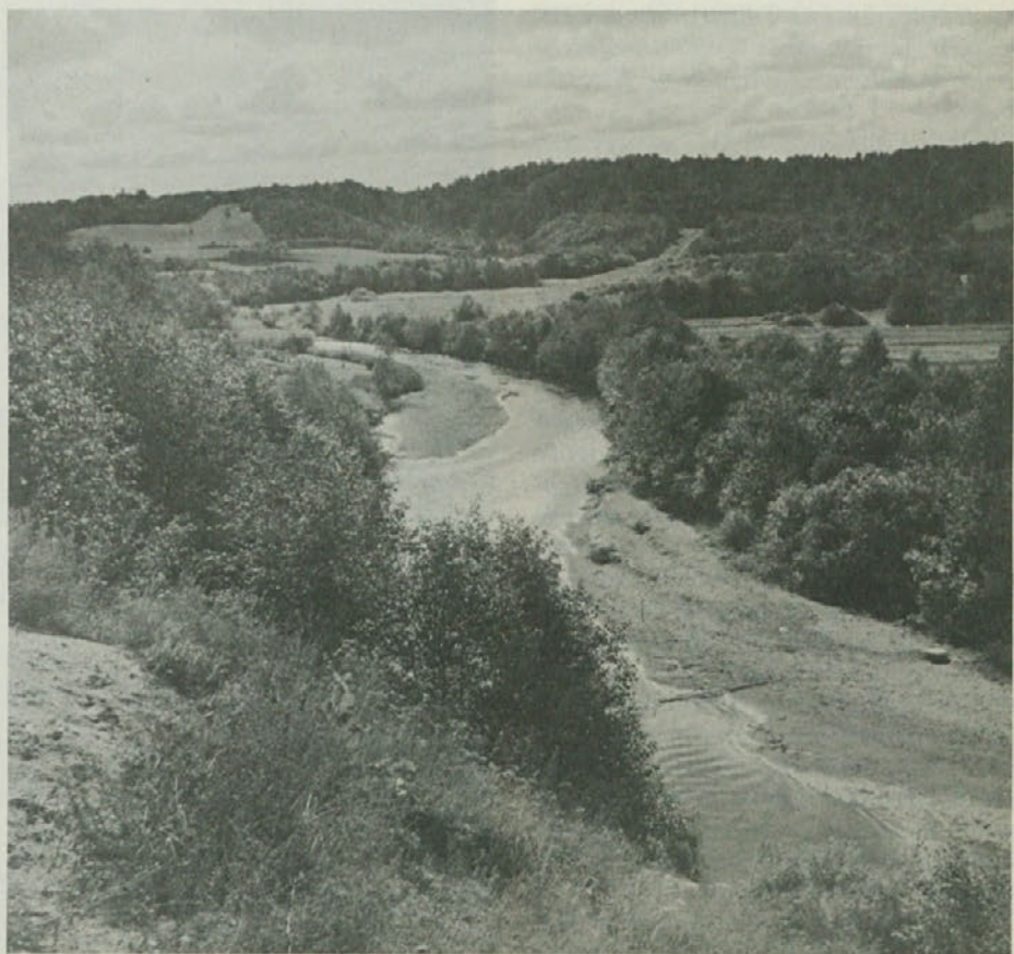
Ob reki na Valdaju, v severni Rusiji.

Njegov aktivizem je naravnost prese-netljiv, sredstva javnega obveščanja (predvsem televizija) pa to aktivnost še podčrtujejo in izkoriščajo. Tako je mogoče skoraj vsak večer slediti, v glavnem TV dnevniku «Vremja», ob devetih, dolge reportaže o potovanjih Mihajla Sergejeviča. Televizijska kamera snema (očitno pozneje tudi montira) neposredne pogovore na ulici, z mimoidočimi, delavci in gospodinjami. Izrečene besede se sicer spreminjajo od primera do primera, vsebina pa je jasna in nedvomna. «Zdravo, Mihajl Sergejevič!» «Zdravo, kako vam gre?»