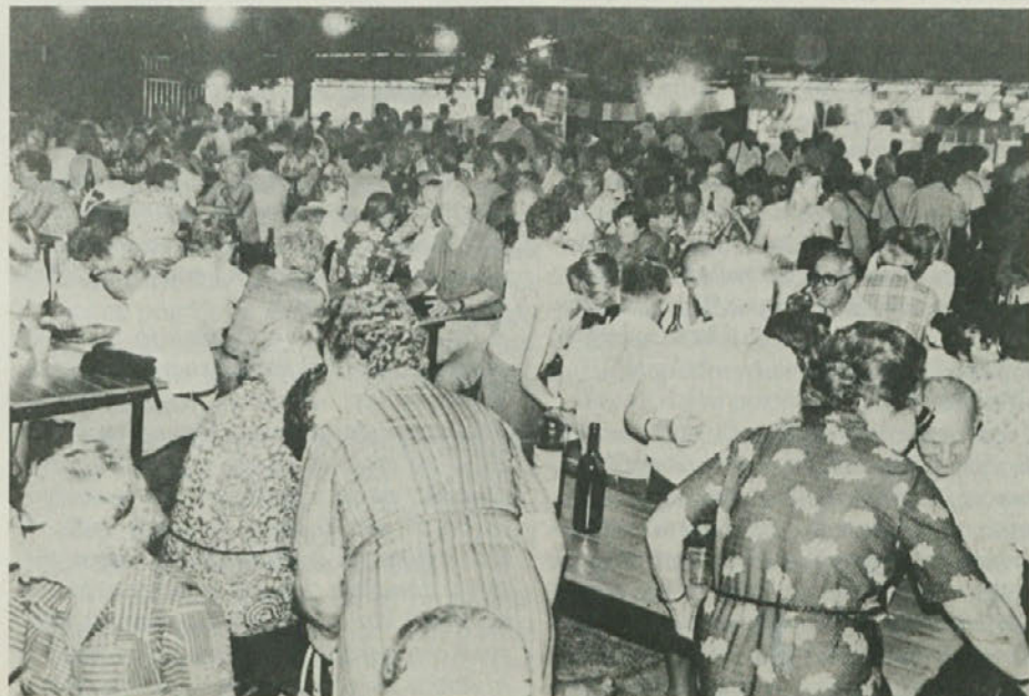
Pri Sv. Jakobu se nadaljuje drugi festival Unità in Dela. Na sliki vidimo prizor prvega praznika v začetku avgusta.

Pa smo v Trstu, kjer smo bili te dni priča škandaloznemu in naravnost nesramnemu obnašanju sedemstrankarske koalicije (KD, SSK, PRI, PLI, PSDI, PSI in LpT), ki se še vedno prepira za županski stolček, pri tem pa pozablja celo na najošnovejše pravilo dostojanstva in nujnosti, da se vsaj v minimalni meri