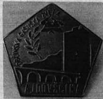
Priznanje Alpini in obratu na Colu