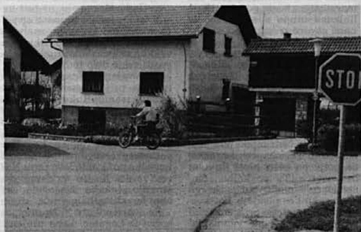
Zares nujna pridobitev za Žiri, označitev prednostnih cest v naglo rastočem naselju