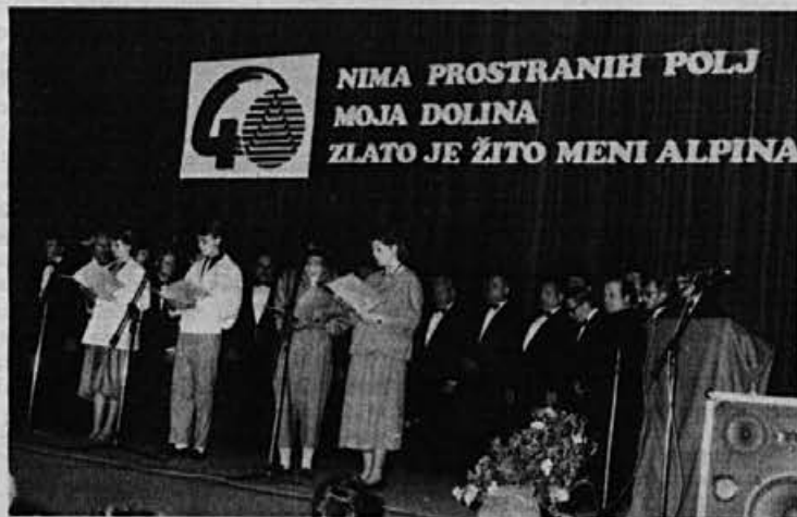
Recitatorji so se izkazali

Nima prostranih polj moja dolina, zlato je žito meni Alpina