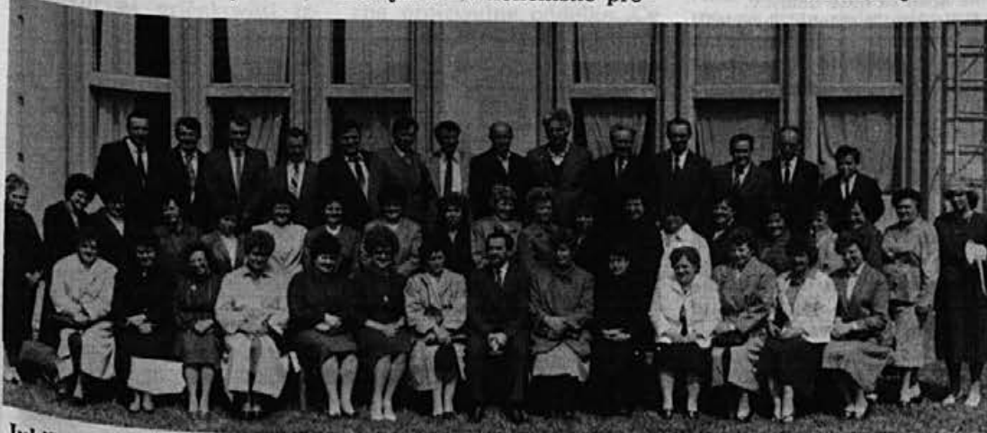
Jubilanti s 30 let skupne delovne dobe