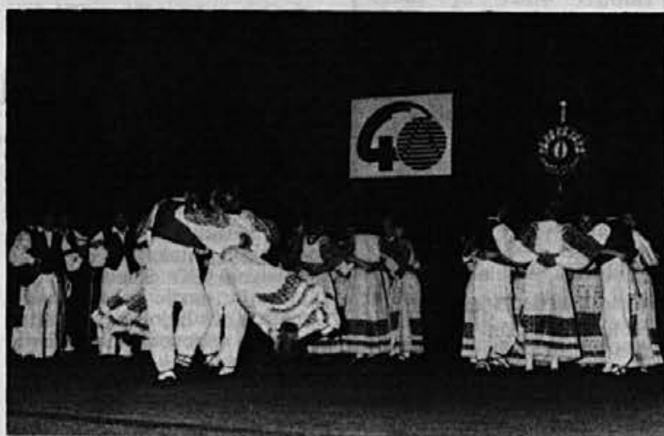
Folklorna skupina iz Novega Marofa je navdušila gledalce