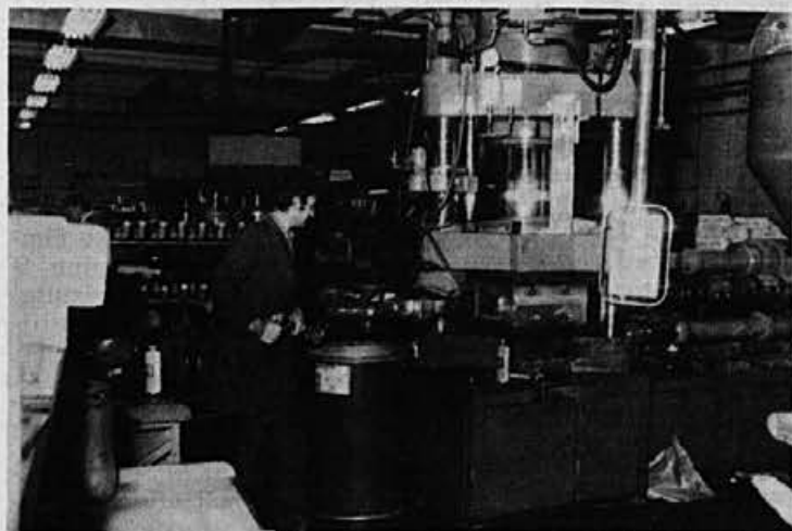
Prizor iz vliivanja čevljev

Ženska sandala, izdelana iz umetnega usnja, v treh barvah: bela, rdeča, črna. Model ima zelo praktično peto.