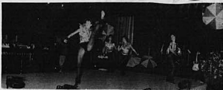
Z lanskoletne modne revije na Bledu

Smučarski čevljev z vstopom zadaj, namenjen nedeljskim smučarjem. Zapevna se z dvema zaklopkama na zadnjem delu čevlja. Notranji čevljev je mehko in toplo oblažen.