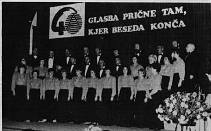
S pevskega srečanja pevcev usnjarsko-predelovalne indu- strije

Prav zaradi zahtevnosti služ- be na terenu, kot je revizor ali