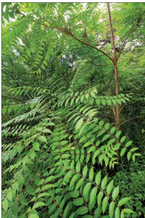
Slika 4: Tujerodni visoki (veliki) pajesen ( Ailanthus altissima ) je ena od invazivnih drevesnih vrst pri nas. Vrsta se ponekod lokalno že zelo širi in lahko predstavlja resen problem.

Figure 4: The non-native tree of heaven ( Ailanthus altissima ) is one of the invasive tree species in Slovenia. The species is intensely spreading on some locations and can represent a real problem.