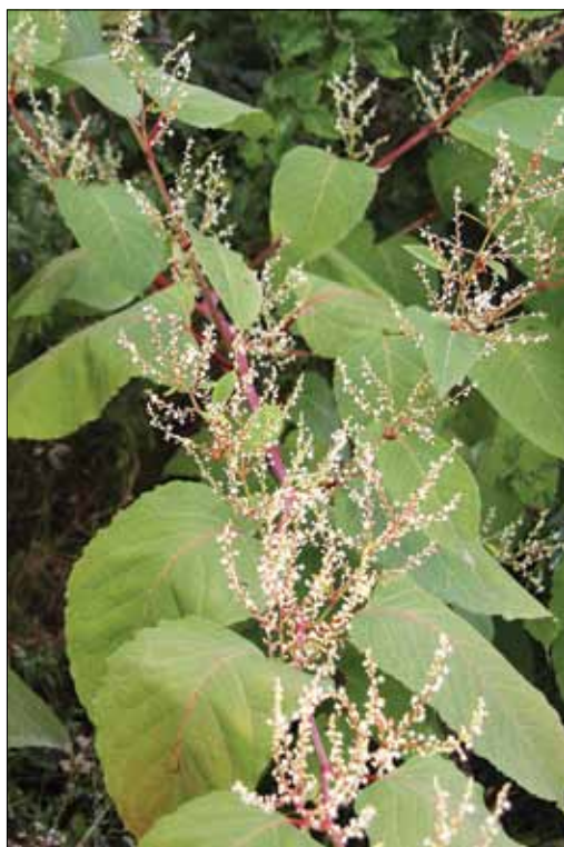
Slika 5: Japonski dresnik ( Fallopia japonica ) je ena od pogostejših invazivnih tujerodnih vrst v različnih obrežnih gozdovih. Vrsta zraste do 2 metra visoko in ima liste dolge do 15 centimetrov. Tej vrsti je nekoliko podoben sahalinski dresnik ( Fallopia sachalinensis ), ki pa z razliko od prvega zraste višje (tudi do 4 metre). Njegovi listi so dolgi do 30 centimetrov in imajo srčasto dno. Pri nas raste tudi križanec med tema vrstama dresnikov, češki dresnik ( F. × bohemica ). (foto: Lado Kutnar)

Poleg sitke smo pridobili podatke o pojavljanju tudi drugih tujerodnih vrst smrek. Tako se v GGO Celje, Novo mesto, Slovenj Gradec v sestojih, skupinah ali posamično pojavljajo drevesa omorike/Pančičeve smreke ( Picea omorika ). Posamezna drevesa ali skupine bodče smreke ( Picea pungens ) so prisotne v GGO Brežice in Tolmin. V GGO Brežice lahko najdemo tudi posamezna drevesa kavkaške smreke ( Picea orientalis ).