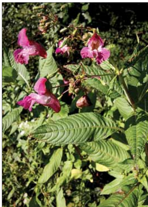
Slika 8: Žlezava nedotika ( Impatiens glandulifera ) je močno razširjena in dobro prepoznavna invazivna tujerodna vrsta. Pojavlja se v različnih nižinskih gozdovih, pogosto ob vodah in gozdnih robovih.

Kot je razvidno že iz manjšega števila prispevkov v strokovnih gozdarskih revijah na temo tujerodnih drevesnih vrst, se je v zadnji četrtini prejšnjega stoletja precej zmanjšalo zanimanje za to področje. V zadnjem času se s temi vrstami ponovno več ukvarjamo v povezavi s procesi globalizacije. Posebno postaja vse bolj aktualna problematika širitve nekaterih invazivnih vrst, ki bi ob spremembah okolja lahko postala še bolj pereča. Med drevesnimi vrstami bi bilo treba več strokovne pozornosti nameniti vse splošno razširjeni robiniji. Prav tako bi bilo treba spremljati tudi dinamiko širjenja in iskati ustrezne možnosti za omejevanje visokega pajesena (glej primere v Brus, 2012).