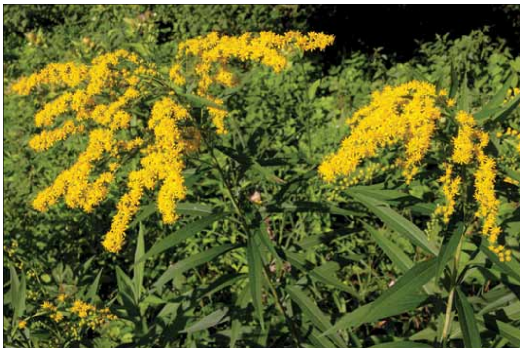
Slika 6: Orjaška in kanadska zlata rozga ( Solidago gigantea , S. canadensis ) sta invazivni vrsti, pogosti v obrežnih, poplavnih, močvirnih gozdovih in drugih nižinskih gozdovih. Razlikujeta se po tem, da ima orjaška zlata rozga golo steblo, pri kanadski je steblo gostodlakavo.

Figure 6: Giant and Canada goldenrod ( Solidago gigantea , S. canadensis ) are invasive species, often found in riparian, flooded and freshwater swamp forests as well as in other lowland forests. They differ from each other by the fact that the giant goldenrod has a bare stem and the Canadian one a densely hairy stem.