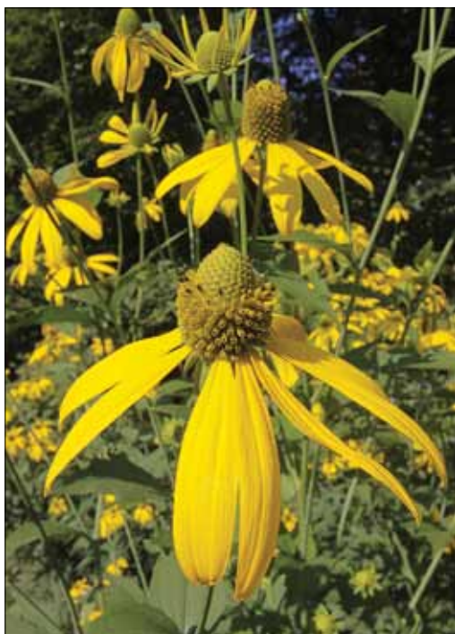
Slika 7: Invazivno vrsto deljenolistno rudbekijo ( Rudbeckia laciniata ) lahko pogosteje srečamo na nekoliko vlažnejših rastiščih. V nižinskih in poplavnih gozdovih gradi obsežne in goste sestoje, ki onemogočajo rast domačim rastlinskim vrstam.

Figure 7: Invasive species goldenglow ( Rudbeckia laciniata ) can be more frequently met on rather wet sites. In lowland and flooded forests, it forms extensive and dense stands that block the growth of the native plant species.