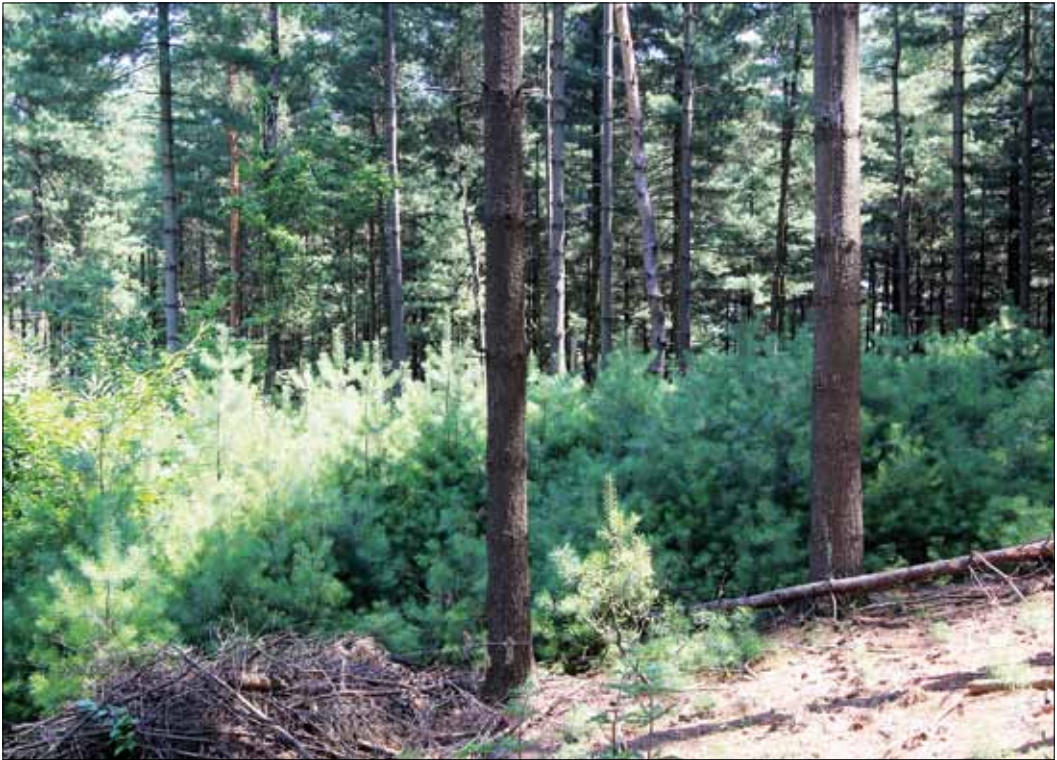
Slika 3: Zeleni (gladki) bor ( Pinus strobus ) je med pogostejšimi tujerodnimi drevesnimi vrstami v naših gozdovih. Ponekod, kot na primer v gozdnih sestojih v okolici Šentjerneja na Dolenjskem, se zelo dobro pomlajuje.

Figure 3: Eastern white pine ( Pinus strobus ) is one of more common non-native species in our forests. On some locations, for example in forest stands in the surroundings of Šentjernej in Dolenjska, it regenerates very well.