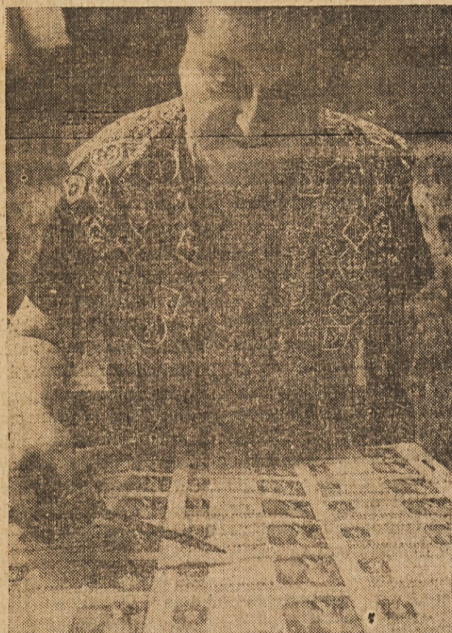
PRI PREGLEDU — V klišarni v Brooklynu, N.Y., pregleduje nadzornica plošče za tiskanje živežnih znamk. Te tiska zakladno tajništvo, poljedelsko pa jih razdeljuje.

SLABI IZGLEDI — Tudi bivši sen. Ralph Yarborough iz Teksasa bi bil rad predsedniški kandidat, če že ne tudi predsednik ZDA. Demokrati imajo nad ducat takih, ki so javno izrazili željo po Beli hiši, zato izgledi R. Yarborougha niso posebno dobri.