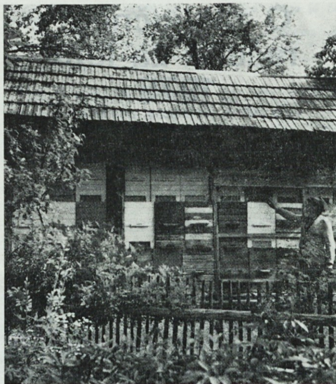
Ali smo res pridni kot čebele?

Tukaj v Glasilu bomo le na kratko podali neke bistvene podatke, ker obseg časopisa ne dopušča obširnejše tolmačenje zaključnega računa.