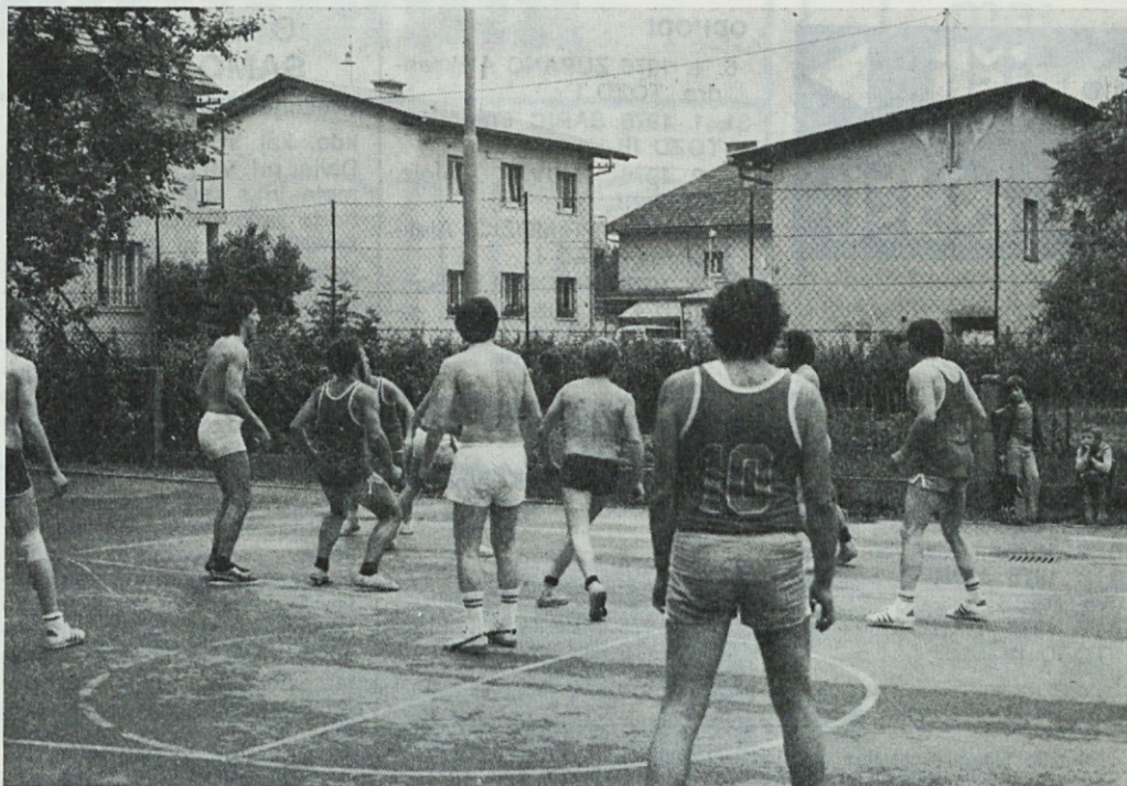
Z lanskoletnega tekmovanja

V počastitev dneva zmage bo 3. 5. 1976 in 7. 5. 1976 organizirano tekmovanje z