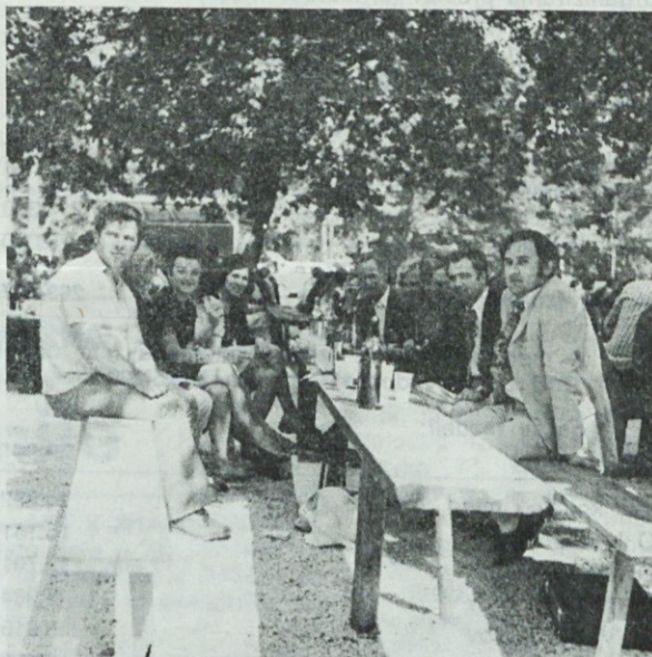
Ze v ZAJČJI DOBRAVI smo se odločili za »DAN AVTOTEHNE«