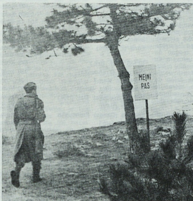
Tu se skriva tista črta z zemljevida, imenovana meja. In tu se začneja tisto, kar imenujemo socialistična in samoupravna skupnost

PRITAVIMO SE VSI NA XX. POHOD PO POTEH PARTIZANSKE LJUBLJANE 9. MATA LETOS !!!