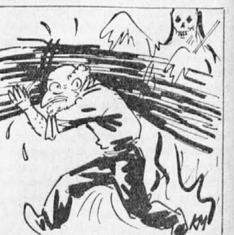
odide proti domu in od takrat ni nikdar več prosil stvari, ki si jih ne želi.