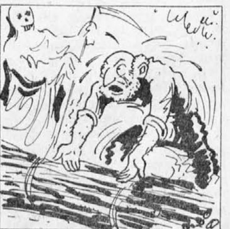
rame, ker sem slaboten.« Smrt mu pomaga zadeti butaro na rame in starček