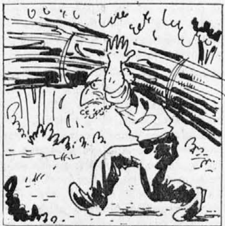
Obložen kot tovorna živina gre počasi proti svojemu domu. Cesta je dolga in