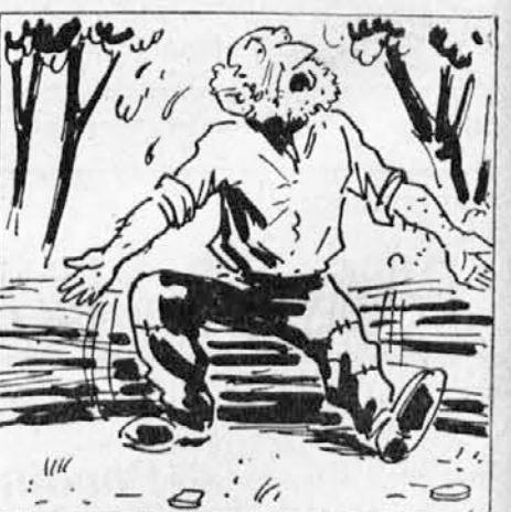
čiva premišljuje o napornem delu in vzdihne: »O smrt, pridi me rešiti!« In glej-