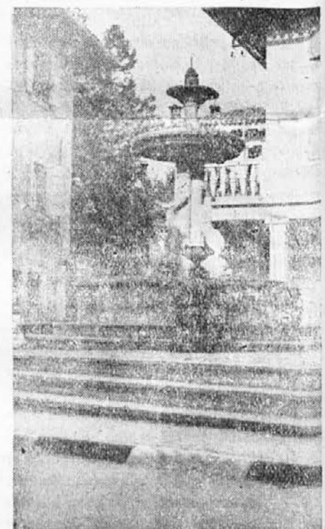
MOTIV IZ SV. PETRA SLOVENOV

Tisti dan je na tisoče ljudi sprejelo Kristusovo vero. S tem čudežem je sv. Duh pokazal, da Kristusov evangelij velja za vse narode in ne samo za Jude