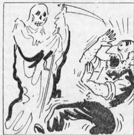
klicati ga vpraša smrt. Starček se sedaj silno prestraši in ves tresoč se ji odgo-