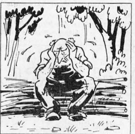
starček se utruji. Vrže butaro na tla in sede nanjo, da odpočije. Medtem ko po-