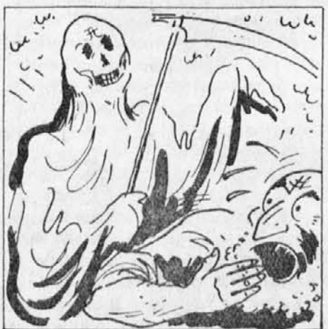
vori: »Oh, nič! Hotel sem, da bi mi pomagala zadeti zopet to težko breme na