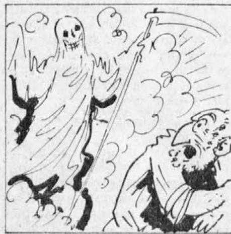
komaj izgovori besedo smrt, se mu ta v resnici prikaže. »Tukaj sem! Zakaj si me