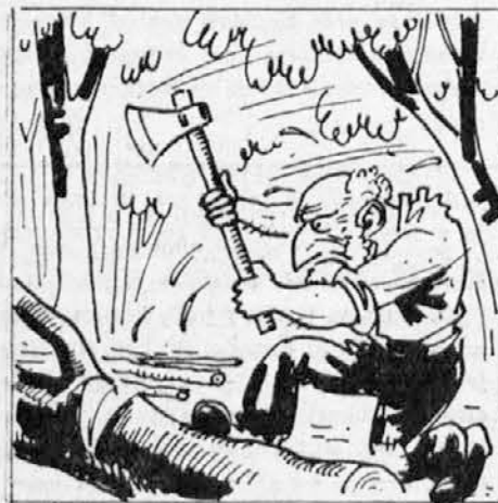
Nekega dne gre starček v gozd sekati drva. Seka ves dan in proti večeru na-