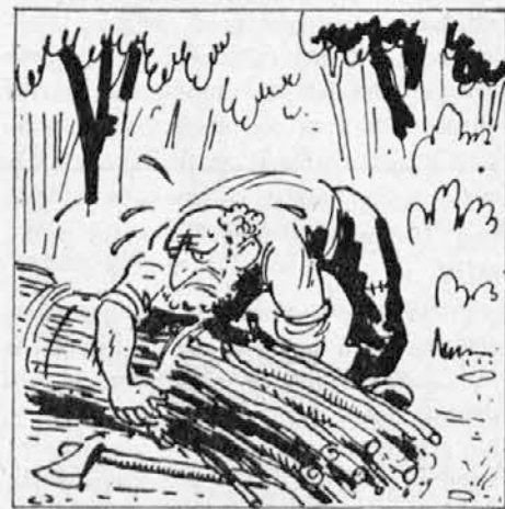
pravi veliko butaro. Butara je zelo težka, da jo s težavo zadene na hrbet.