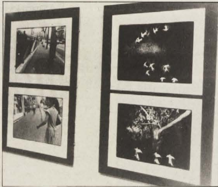
Pogled na del razstavljenih slik

Vsem, ki imajo odnos do umetnosti, priporočamo, da si razstavo Bavčarjevih črno-belih umetniških fotografij v kulturni taberni Pri Joklnu ogledajo; odprta je do konca januarja.