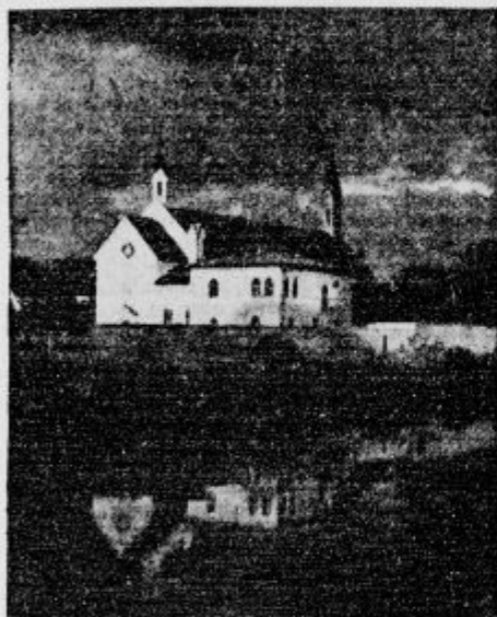
Pogled na samostan karmeličank na Selu ob levem bregu Ljubljanice Dne 12. junija je preteklo 60 let, ko so prišle na Slovensko prve karmeličanke in se nastanile na Selu.