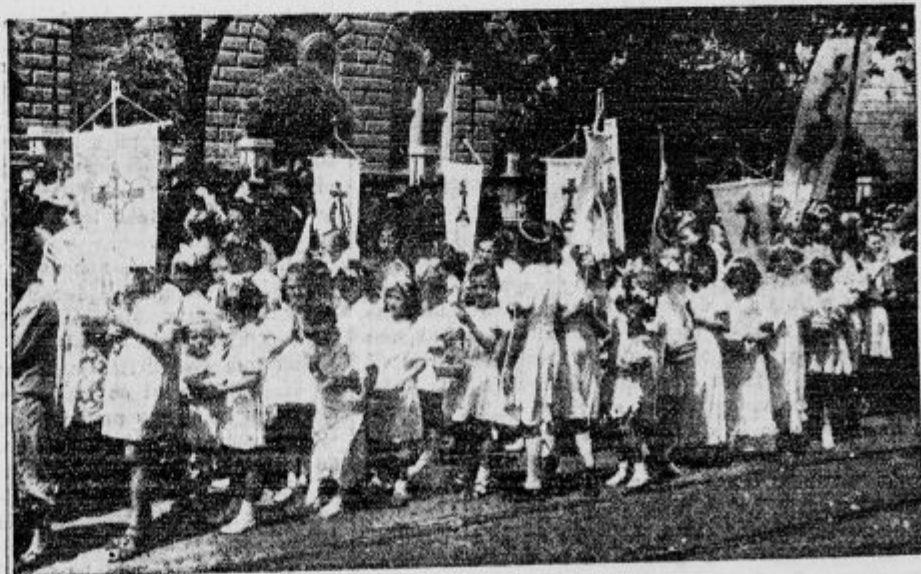
Šolski otroci pri procesiji sv. Rešnjega Telesa v Belgradu