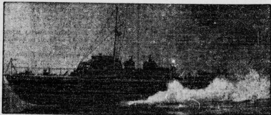
Najnovejši angleški torpedni motorni čoln, ki pri najhitrejši vožnji lahko izstreljuje torpeda.

Vsak Slovenec, vsak katolik je naročnik Mohorjevih knjig Naročite jih pri župniku