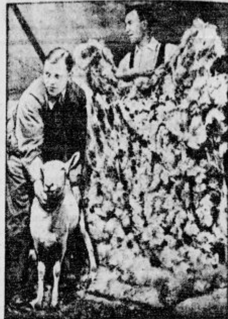
iz vse Anglije so prišli pred kratkim kmetje v London, da se udeležijo zanimivih tekem, kdo bo hitreje in bolj čisto ostrigel ovce. Na sliki vidimo eno teh žrtev tekmovanja.