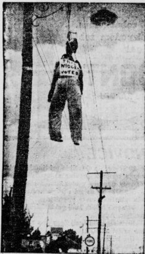
Pred volitvami v Miami na Floridi je tajna organizacija Ku-Klux-Klan izvajala velik pritisk na samorske volilce. Poleg drugih groženj je pred volišči obesila nagačenega zamoreca v človeški velikosti z napisom: »Ta zamorec je volilec.«