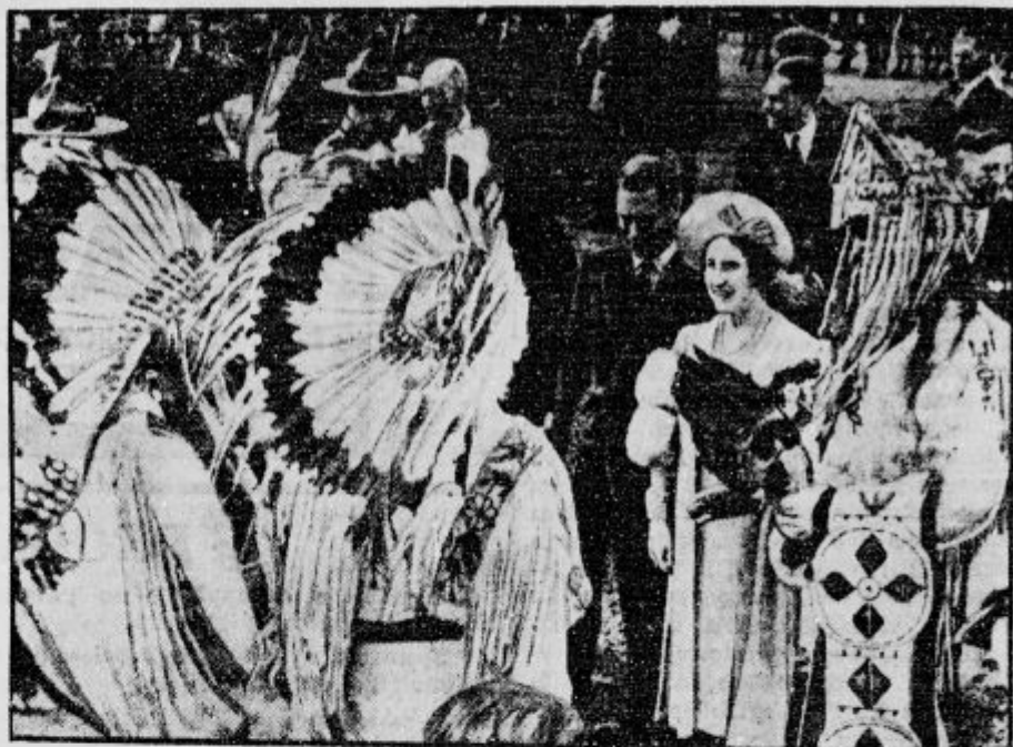
Angleškega kralja in kraljico so v Kanadi pozdravili tudi zastopniki Indijancev. Slika nam kaže prizor ob sprejemu v mestu Calgary