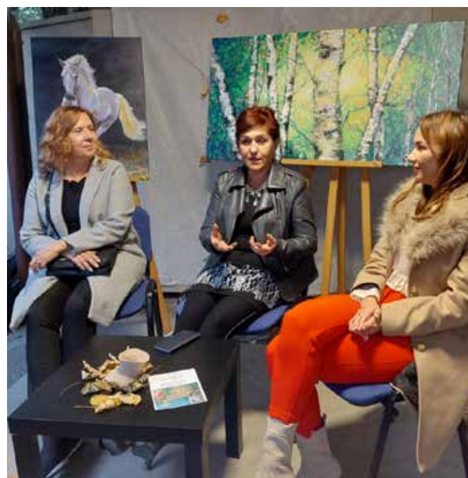
Otvoritev razstave Možgane na pašo