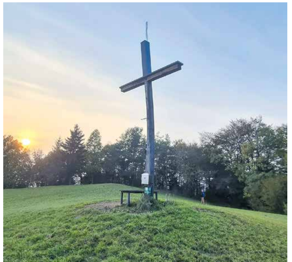
Pri križu PD Polž organizira vsako leto sveto mašo za pohodnike in srečno pot v gorah.