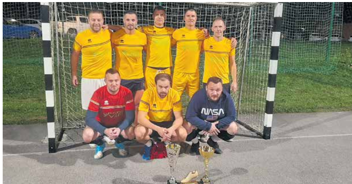
Občinski prvaki v futsalu 2022