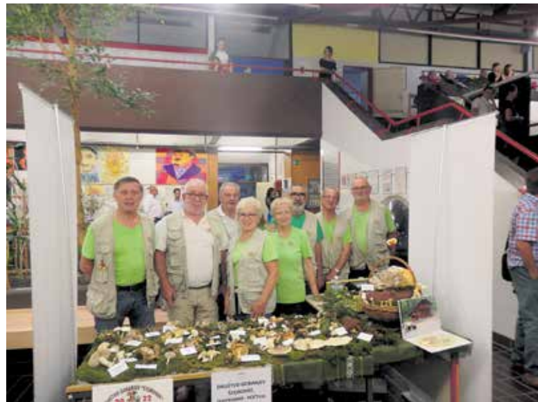
Sodelovanje Društva gobarjev Štorovke Šentrumar Hočevje na prireditvi v Ivančni Gorici Vsi smo ena generacija

glive same ne morejo proizvesti in si jih morajo zato na različne načine priskrbeti. Goba živi v gozdu v simbiozi z drevesnimi vrstami, je pa tudi hrana celi vrsti živali. Mnoge gobe, tudi strupene, pa so zelo pomembne za rast in razvoj rastlin, s katerimi so povezane preko podgobja. Zato je vsako uničevanje gob z vidika varovanja narave nedopu-