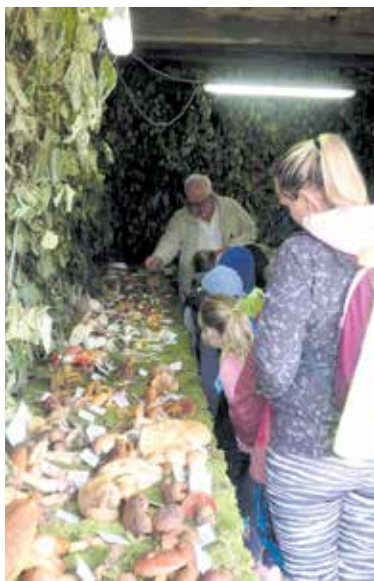
Učenci OŠ Zagradec, PŠ Krka so si ogledali razstavo gob v Hočevju 19.9.2022

Glive hrano črpajo iz okolja, v katerem živijo – predvsem organske snovi, ki so jih predelali drugi, višje razviti organizmi. Organske snovi