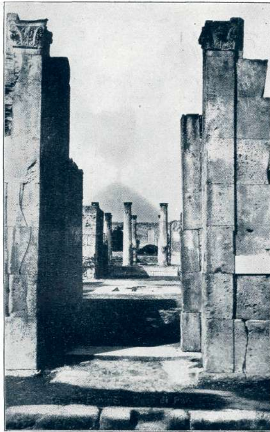
Pompei: Pansova hiša