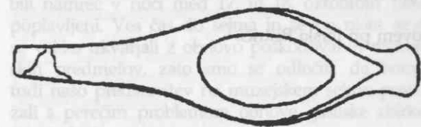
Bronasta sekira, izkopana na Dolnjem Zemonu, sodi v čas do 1500 let pred našim štetjem; hranijo jo v Narodnem muzeju v Ljubljani