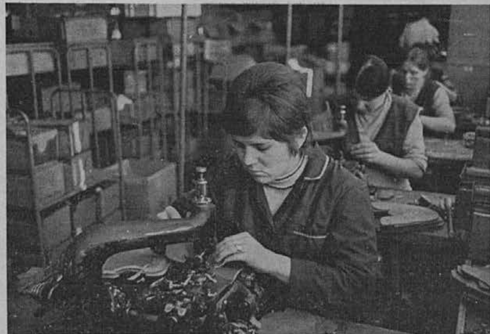
Proizvajalci se trudijo, da bi povečali storilnost, kljub nestimulativnim administrativnim ukrepom.

Po zaslugi Republiške go-spodarske zbornice nas je Zvezni sekretariat za zuna-jo trgovino med kolektivnim dopustom le poklical v Beograd, kjer smo morali najprej prikazati višino lanskoletnega uvoza granulata. Upoštevali so le naš redni uvoz 115 ton. Uvoza 20 ton granulata, ki ni bil povsem v skladu s predpisi (to smo morali napraviti, da ni pri-šlo do zastojev v proizvod-nji pancrjev), niso hoteli upoštevati. Za letošnje leto so nam sedaj odobrili ko-maj 90% lanskoletnega uvo-za granulata, t. j. 105 ton. Od tega smo 79 ton granu-lata že uvozili v I. polletju in ga že skoraj v celoti po-rabili. Z zahoda torej lahko uvozimo še 26 ton, kar bo zadostovalo za mesec avgust in deloma še za september. Zvezno zbornico za zunanjo trgovino v Beogradu smo vprašali, kje je tu logika. Naš celoten kolektiv se trudi, da iz leta v leto povečuje izvoz na zahodna tržišča, oni pa nam letos odobrijo uvoz manjših količin granulata kot smo ga porabili lansko leto pri manjši proizvodnji. Odgovorili so nam: Razliko Nadaljevanje na 2. strani