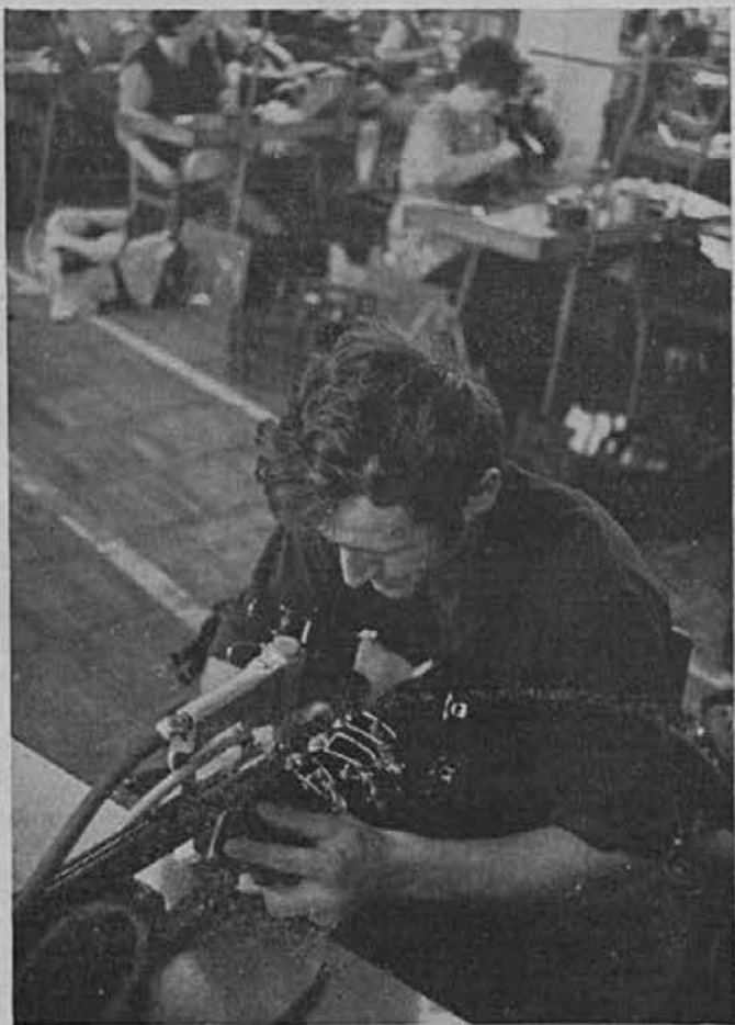
Sponkanje pri sestavi gornjega dela smučarskega čevlja.