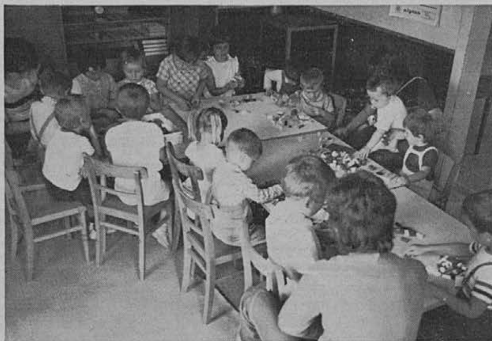
Malčki v žirovskem vrtcu so na tesnem. Na primerne prostore bodo morali še malo počakati.