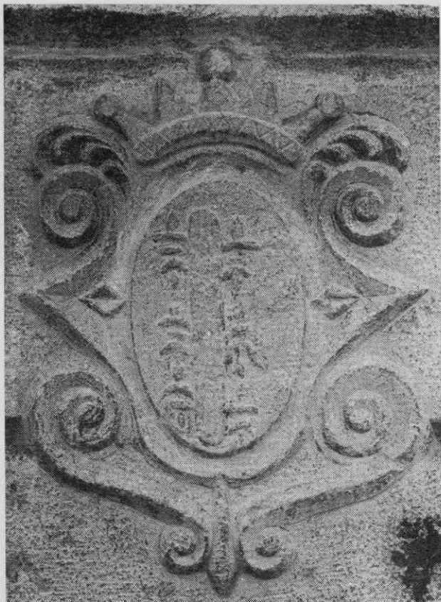
Podestatski grb na stebri fontika v Izoli (15. stoletje)

Kaže, da je ta odredba prenesena v statut iz leta 1360 iz neke prejšnje redakcije statutov, kajti zadnji stavek, ki je očitno na-