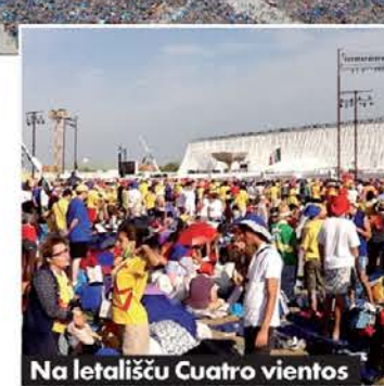
Na letališču Cuatro Vientos

SDM-ja ocenjujejo na 50 milijonov evrov; to vsoto pa ni plačala samo država, temveč tudi španska Cerkev, prostovoljci, družine. Če pa ocenimo, da je vsak romar za kosila, spominke, muzeje, mestne prevoze itd. porabil nekaj sto evrov, lahko takoj ugotovimo, da je španska ekonomija z dogodkom gotovo pridobila. El Mundo poroča o 148 milijonih evrov dobička in 2.761 novih delovnih mestih. Arturo Fernández, predsednik madridskih delodajalcev, govori o 160 milijonih evrov dobička samo za restavracije in hotele. K temu lahko prištejemo še vidljivost, ki jo je SDM dal Madridu in Španiji nasploh z več kot 4.700 akreditiranimi novinarji.