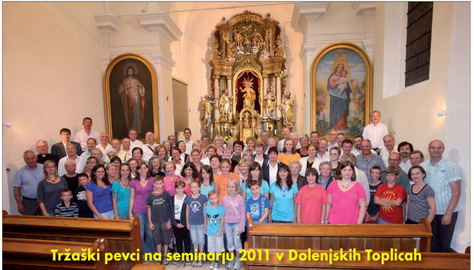
Tržaški pevci na seminarju 2011 v Dolenjskih Toplicah

Seveda se vse te zadeve še kako tičejo tudi nas, Slovencev v Italiji, saj naše zamejstvo ni nikakršna "oaza miru in blagostanja". Že dejstvo, da se premalo na glas sprašujemo, kaj bo z nami, če bomo dovolili, da se ukine statut posebne dežele Furlaniji Juljski krajini, ki ga ima samo zaradi naše prisotnosti v njej, kaže na veliko potrebo po večjem in tesnejšem združevanju med nami, predvsem pa kaže na nujno po takojšnji organiziranosti in skupno politično predstavništvo, ki naj od sedanje deželne vlade zahteva pojasnila, predvsem pa naj nas spet poveže, tudi danes namreč velja, da je v slogi moč!