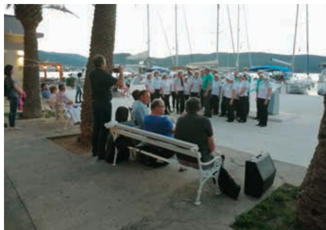
»Notranjska« med koncertom v Kutu na Visu