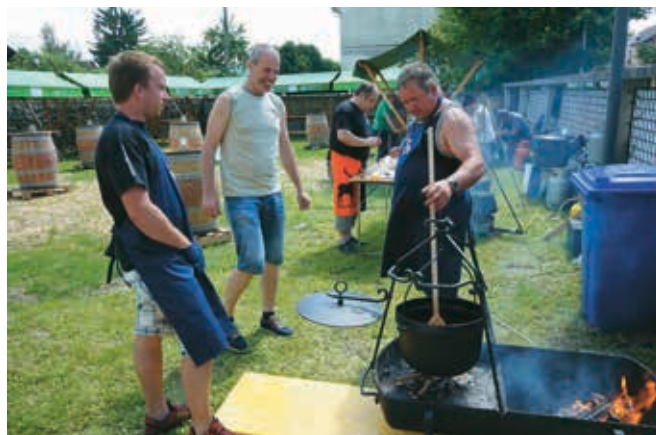
Tako je zjedmi: pripravljamo jih dolgo časa, pojemo pa jih hitro. Na fotografiji ena od ekip, ki so pripravljale golaž.

Današnji podjetnik mora razpolagati s široko paleto znanj, ki jih mora nenehno nadgrajevati. Izobraževanje je ena temeljnih dejavnosti zbornice, zato je prostor našla tudi ob prazniku obrti. Letošnji intenzivni strokovni seminar je bil