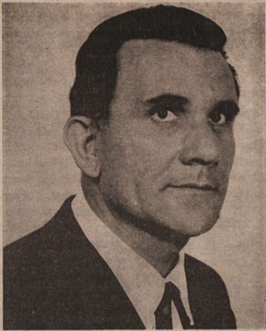
našemu ljubljenu možu in atu