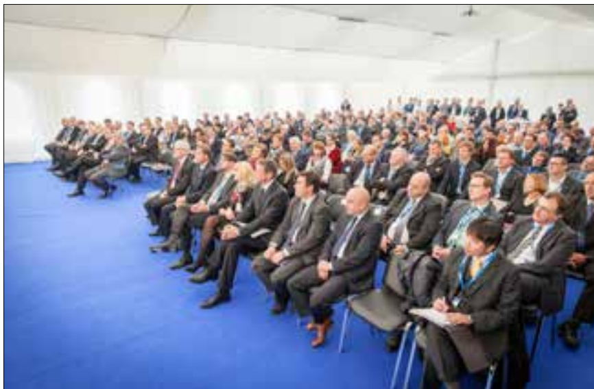
Številna udeležba na praznovanju 100 letnice Yaskawe Electric Corporation

Premier Cerar je v svojem nagovoru poudaril, da je Yaskawa tudi odličen dokaz, da spodbude, ki jih Slovenija namenja tujim investicijam, deluje-