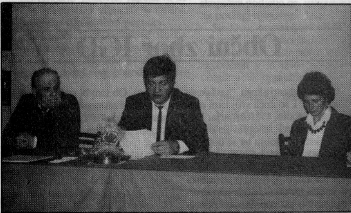
Člani delovnega predsedstva.

Udeležba na občnem zboru je bila izredno dobra, poleg domačih gasilcev in gostov so bili prisotni tudi predstavniki društev iz Tržiča (Pe-ko, ZLIT, Tokos, Lepenka) in Elana iz Begunj, tako da je tudi v tem oziru občni zbor v celoti uspel.