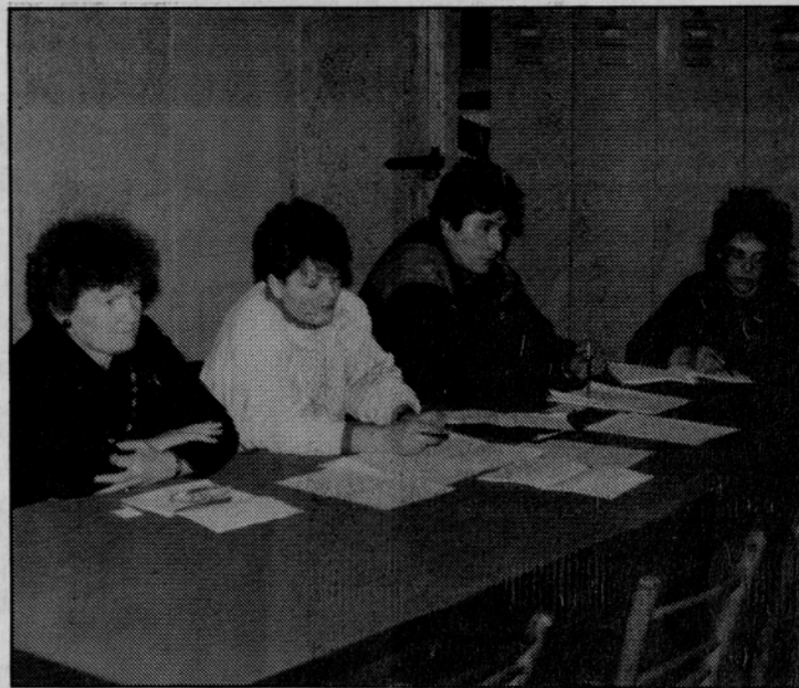
Delo občnega zbora je vodilo delovno predsedstvo.