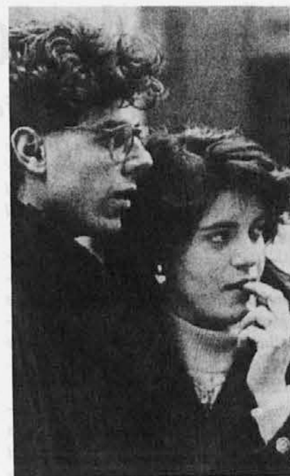
Ko bi vedeli, kako radi živimo!

V ponedeljkih bomo na tretji ali četrti strani dnevnika med lokalno kroniko še našli trpkov novico, morda še s fotografijo nesrečnežev minulega tedna ali pa skrotovičenega