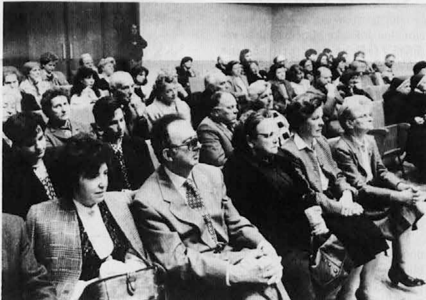
Občinstvo na predstavitvi filma v Katoliškem domu.