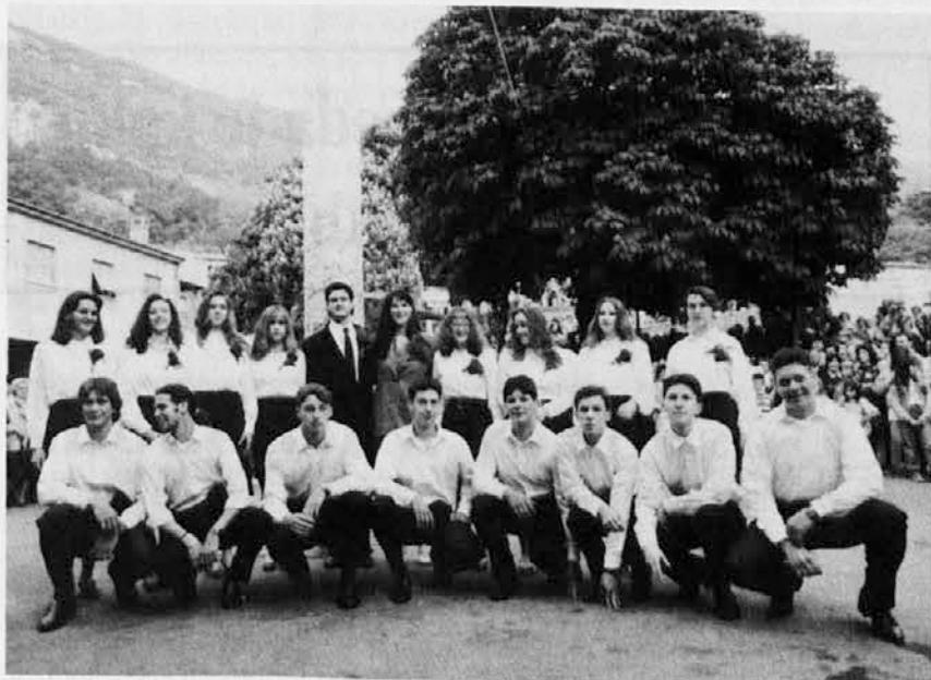
Letošnji mladi dolinski parterji

Mož je torej ves poglobljen v versko razsežnost. Samo če se postavimo na to njegovo stališče, moremo res doumeti smisel njegovih trditev. S tega vidka so nesmiselne znane opredelitve (konzervativno-naprednež, desničar-levičar), ker izvirajo iz čisto drugačnih pogledov, se pravi iz političnih kategorij, in jih zato ni mogoče uporabljati na verskem področju, saj je to, kakor pravi Pascal, »drugačne razsežnosti, ki presega vse druge, tako v globino kakor v višino«.