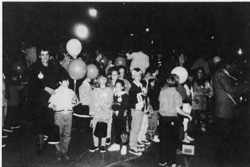
Mladi udeleženci povorke miru