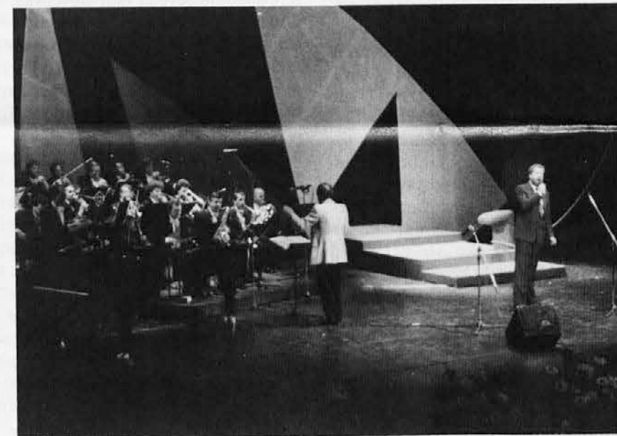
Prizor iz letošnjega Festivala slovenske popevke