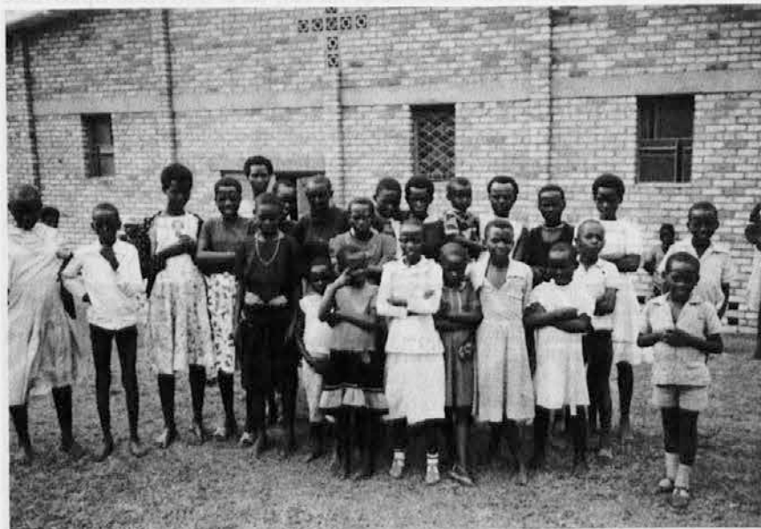
Verniki pred cerkvijo sv. Janeza Bosca