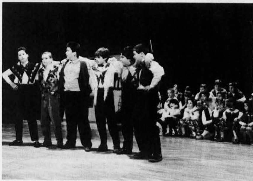
Nastopajoči na odru Katoliškega doma