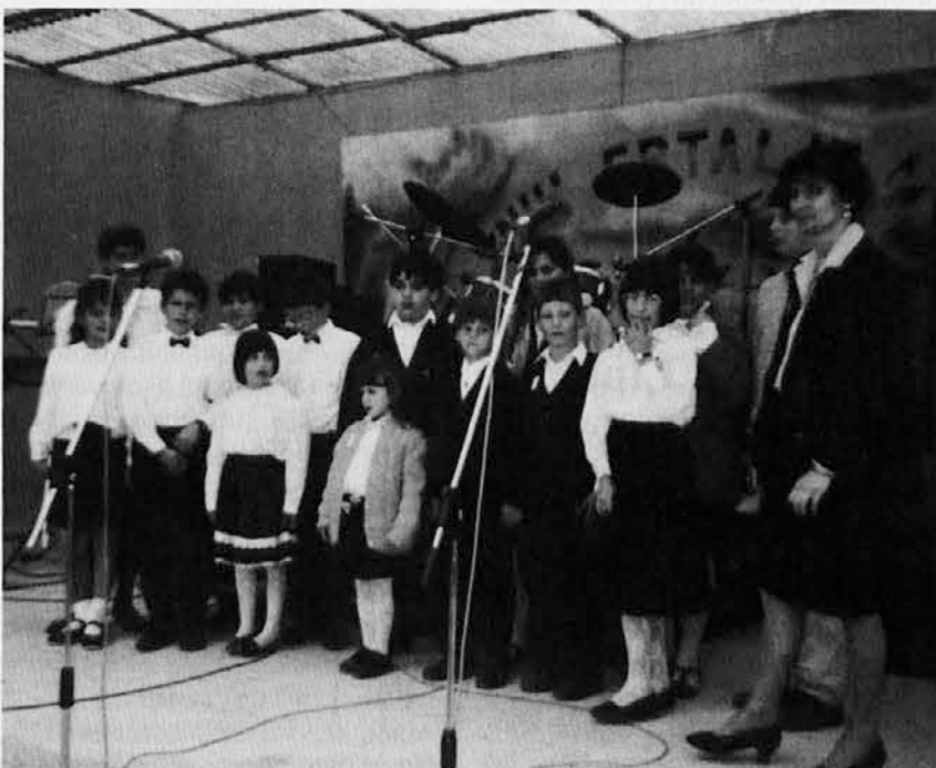
Nastopal je tudi mladinski zbor Vrh sv. Mihaela