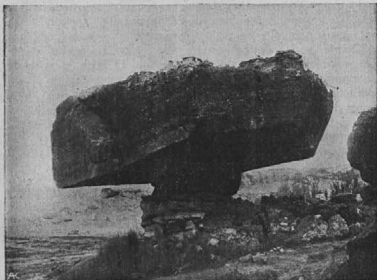
Fobank-skala v Bazuto-deželi.