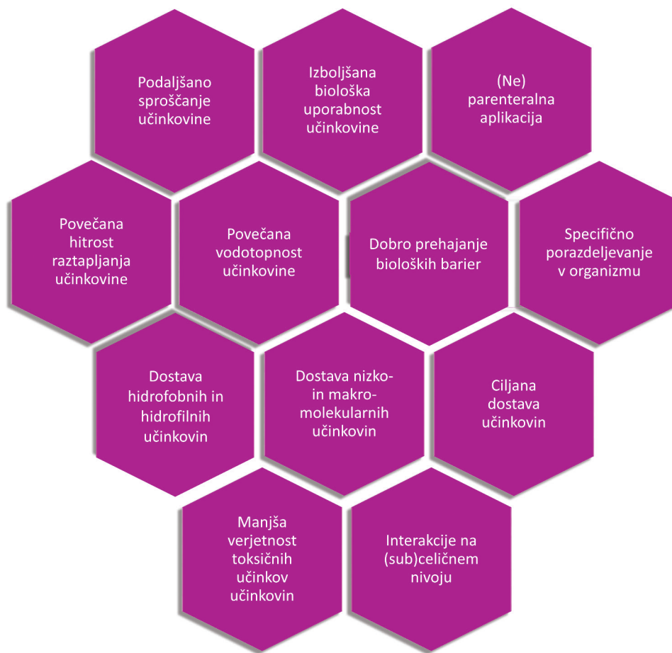
Slika 1: Prednosti nanodostavnih sistemov pred dostavnimi sistemi večjih velikosti.

Vse od raziskav in razvoja prvih nanodelcev za dostavo učinkovin, ki so jih razvili v skupini Petra Paula Speiserja v poznih šestdesetih letih prejšnjega stoletja, pa do danes je bilo razvitih mnogo nanozdravil (6). Pogosto prihaja do zmotnega enačenja celotne skupine nanozdravil z le eno tehnolo-