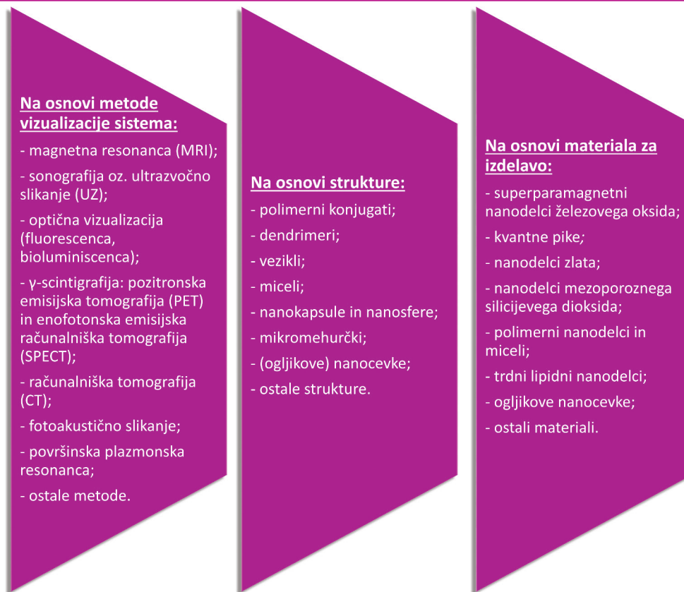
Slika 4: Različne razdelitve nanoteranostikov.