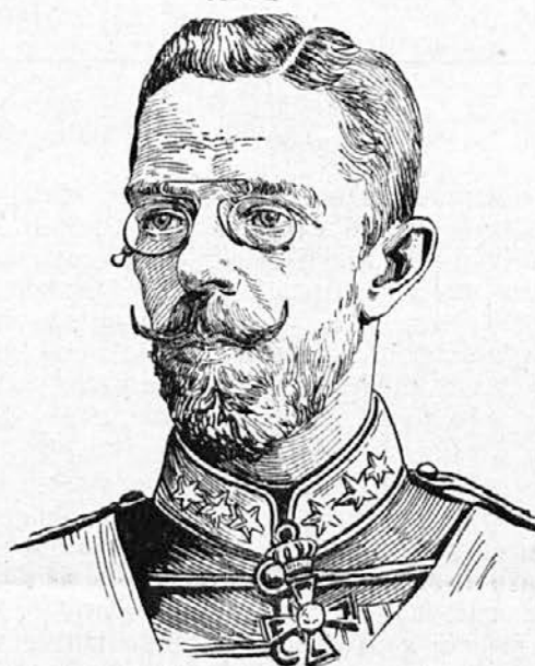
Švedski kralj Gustav, ki je nevarno obolel.

Švedski kralj Gustav ni nenevarno zbolel; ima namreč želodčno in črevesno bolezen. Kralj se je porodil dne 16. junija 1858, je obiskoval šolo, kjer je sedel s sinovi srednjega stanu na eni in isti klopi, študiral l. 1877—1878 v Upsali in Kristijaniji in se nato podal na potovanje po Evropi. Najraje se kralj Gustav peča z vojaškimi vprašanji in socialno politiko, zlasti pa posveča svojo paznost konjeništvu in je pri konjenici dosegel vsa dostojanstva. Kralj Gustav je oženjen z badensko princesinjo Viktorijo, vnukinjo nemškega cesarja Viljema I., ki se je porodila 7. avgusta 1862. Iz tega zakona so trije sinovi.