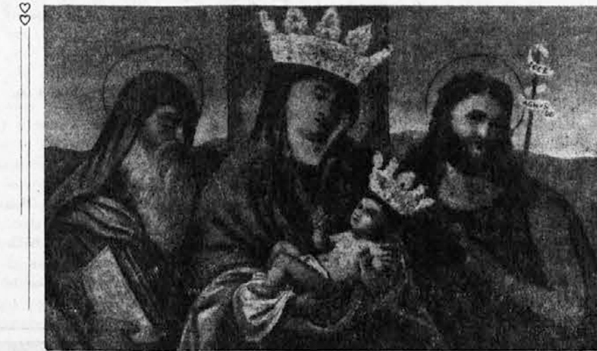
V SOBOTO 18. JUNIJA BO PRAZNIK PRIKAZOVANJA M. B. NA SVETI GORI. V TEH NEGOTOVIH ČASIH SMO NJENE POMOČI SE BOLJ POTREBNI OBRACAJMO SE K NJEJ IN NE BOMO OSRAMOČENI.

Naj titovski in njim udinjeni listi v domovini in v zamejstvu molčijo, kolikor hočejo o tej grozni moritvi, ne bodo izbrisali s sveta spomin nanjo. Vsi pošteni Slovenci doma in