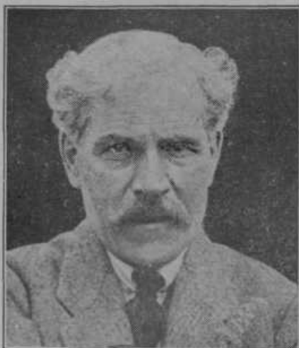
Macdonald, angleški min. predsednik.