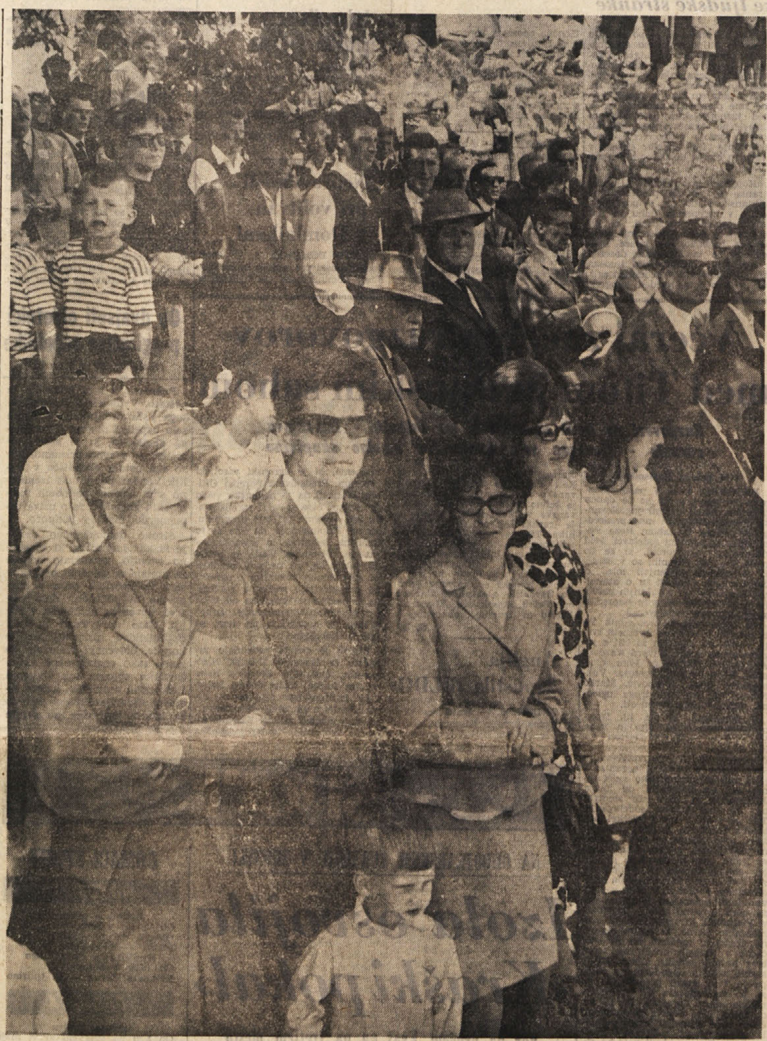
Del udeležencev tretjega obmejnega srečanja, ki je bilo v nedeljo, 29. maja v Dobrovem