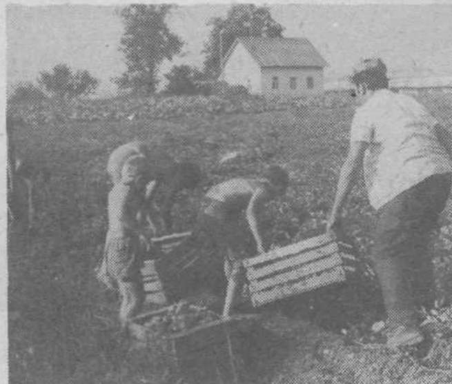
Kogojevi pobirajo krompir — (Vse slike — DARJA)

LABAŠIČA . Navdušeno je povedal: »Devet dni sva z ženo preživela v kampu Čikat na Malem Lošinju, kjer ima naša tovarna več prikolic. Za dan bivanja sem moral v po-