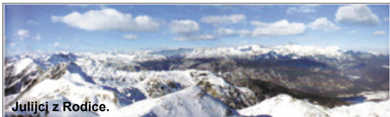
Julijc z Rodice.