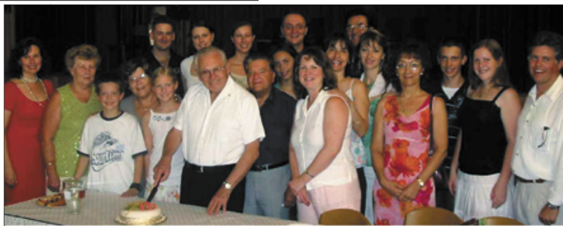
Pater Valerijan je zarezal v sladko torto. Vsak bo dobil košček!