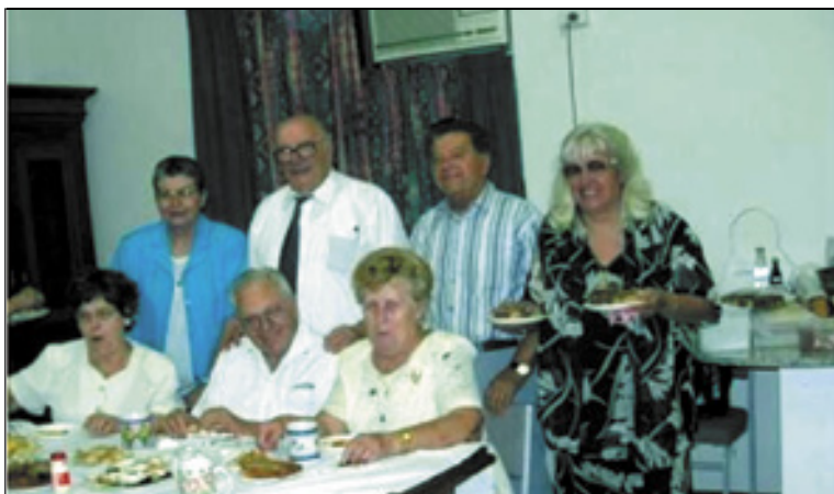
Veselo razpoloženje po sveti maši v Newcastlu.

Družina je prispela v Avstralijo junija 1949 z ladjo Anna Sale. Preko Bathursta so prišli v taborišče Greto.