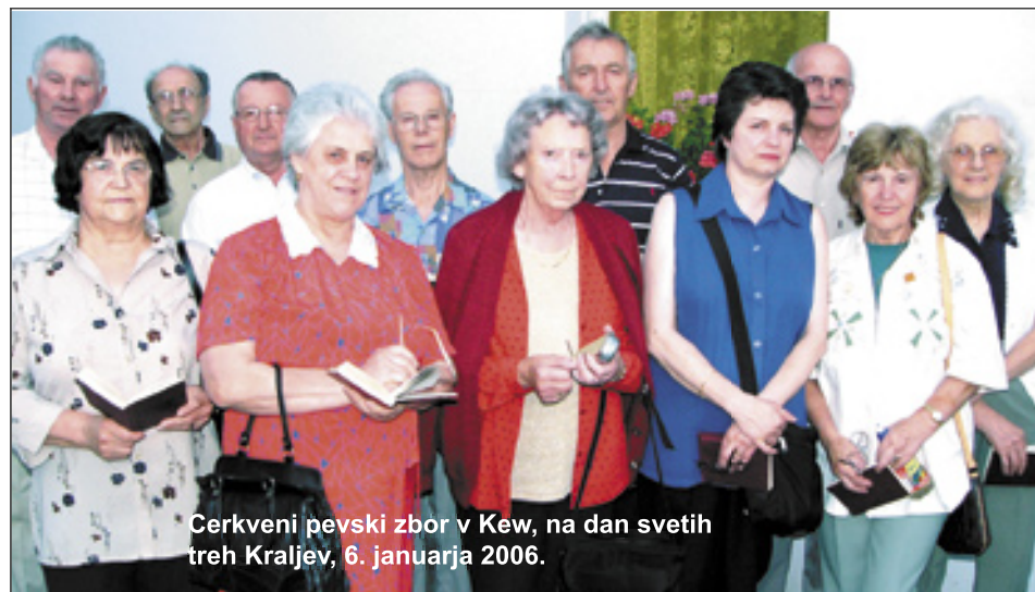
Cerkveni pevski zbor v Kew, na dan svetih treh Kraljev, 6. januarja 2006.