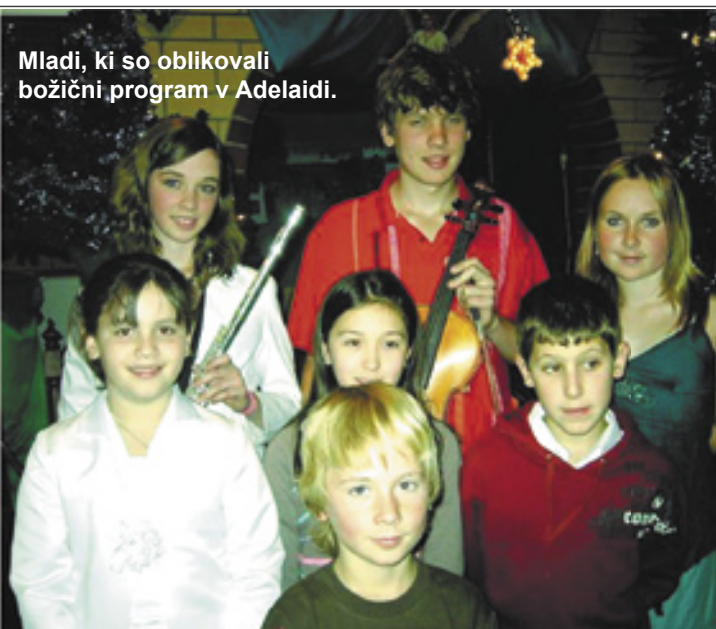
Mladi, ki so oblikovali božični program v Adelaidi.