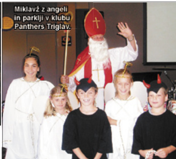
Miklavž z angeli in parklji v klubu Panthers Triglav.