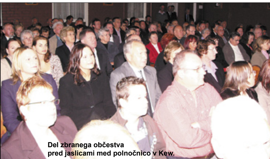
Del zbranega občestva pred jaslicami med polnočnico v Kew.