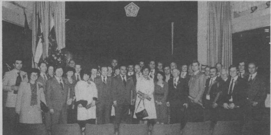
V kulturnem domu na Vevčah so bili 23. maja slovesno podeljeni srebrni znaki sindikatov Slovenije. Občinski sindikalni svet naše občine je to visoko priznanje podelil 35 posameznikom in petih osnovnim organizacijam. Nagrajence smo obširneje predstavili že v prejšnji številki Naše skupnosti. Na sliki: letošnji nagrajenci po končani slovesni podelitvi D. J.

zagotovile tako sindikalne aktiviste, ki bodo kar najuspešneje reševali probleme in tako nadaljevali delo sindikalne organizacije. MARIJA LUKEŽIČ