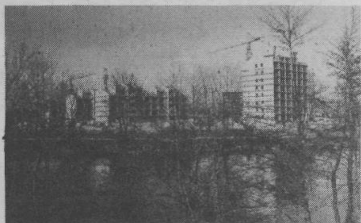
Družbeno usmerjena gradnja razširjene 1. etape nove stanovanjske soseske fužine, v kateri bo 1641 raznih stanovanj, je v polnem razmahu. Dela potekajo po načrtu, saj gradijo tako rekoč noč in dan. Jeseni bodo v teh objektih že prvi stanovalci. HVASTIJA