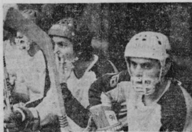
Strah pred Tašmajdanom?