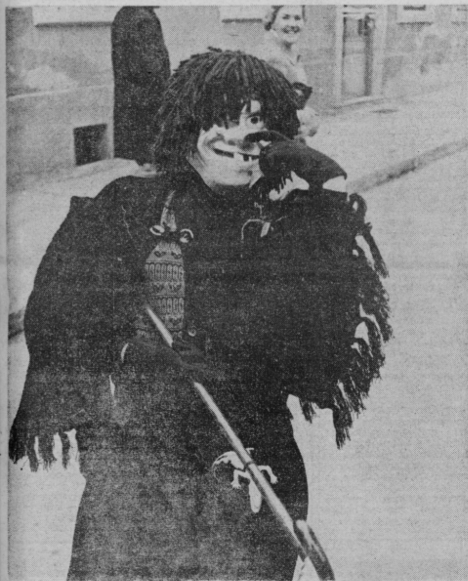
Tale pustna maska ima svojevrsten izraz: kot bi hotela reči, da smo se v Celju spet obrisali pod nosom za karneval, ki so ga ljudje želno čakali na celjskih ulicah. Pa kdaj drugič!