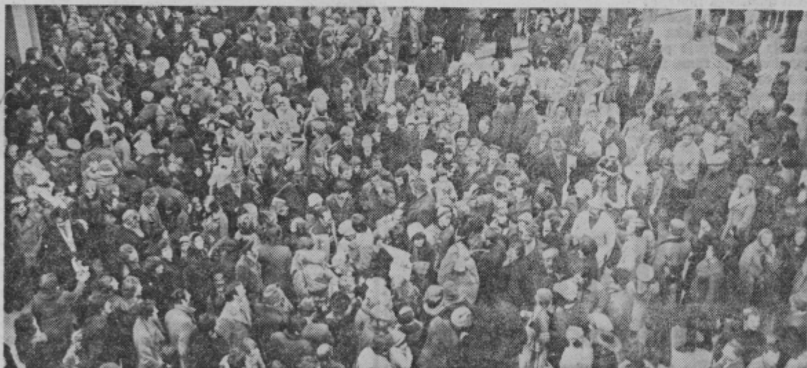
Na celjskih ulicah je bilo v torek popoldne toliko ljudi kot že dolgo ne. Vsi nestrpni so čakali na — karneval. Čakali so, čakali in ... niso dočakali. No, mask je bilo vseeno dovolj, sploh pa, če k njim prištejemo tudi dolge nosove ...