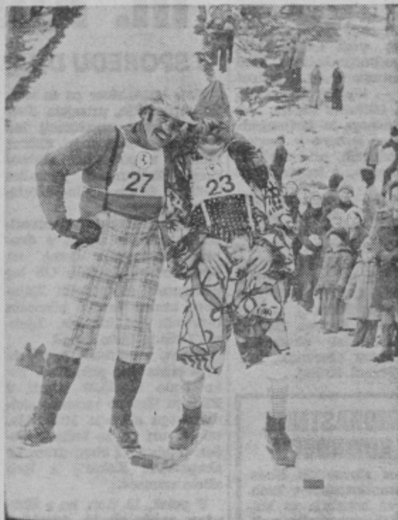
V Braslovčah so v nedeljo pripravili tekmovanje mask v smučarskih skokih. To, da so v Braslovčah skakale maske, seveda nima nič skupnega s člani državne reprezentance. Ze zato, ker so nas Braslovčani tokrat spravljali v dobro voljo in smeh, naši reprezentanti pa kvečjemu le v smeh ...