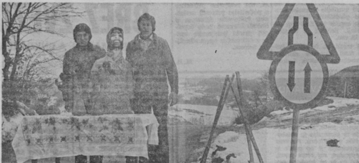
Ta posnetek je iz Buč pri Kozjem. Fantje so pripravili šrango na cesti, kjer je že itak prometni znak za zoženje ceste. Nn ker je bil zraven še pustni čas, so za ženje ceste. In ker je bil zraven še pustni čas, so za tudi prikupno nevesto ...