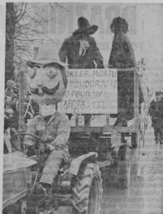
TABORA VIDEL NE BO! Tako je pisalo na enem izmed tridesetih vozov, ki so sodelovali na karnevalu na Vranskem. No, tako hudo pa spet ni. Tudi na žalsko avtobusno postajo človek ne more priti po nobenih prometnih predpisih, pa ljudem to vendarle uspeva. Tu in tam se sicer sliši nesramna kletvica, ali pa lahko vidimo kakšen zanimiv padec, seveda pa vse to še ni vzrok, zaradi katerega bi se na žalski komunalni skupnosti lahko zamislili nad svojim delom.

V Celju je bilo letos klavrno. Optimisti so sicer pričakovali pustni karneval. Treba je priznati, da je v Celju precej optimistov, saj se je v torek zbralo na ulicah mesta ob Savinji mnogo ljudi, ki so upali, da bodo videli karneval. Optimistov je v Celju torej dovolj. To konec koncev že dolgo vemo. Navsezadnje lahko le še optimisti živijo v tako onesnaženem okolju in ob taki vodi. Sicer pa, preberimo in oglejmo si našo reportažo o pustnih dogajanjih, ki so jo pripravili Drago Medved, Tone Tavčar, Milan Božič, Lojze Ojsteršek in Janez Vedenik (besedilo).