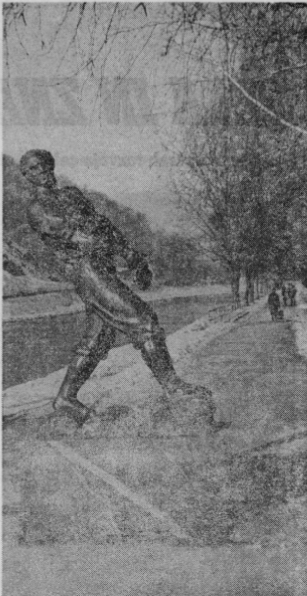
Celje ob Savinji v dneh, ko je bilo tudi v dolini več snega