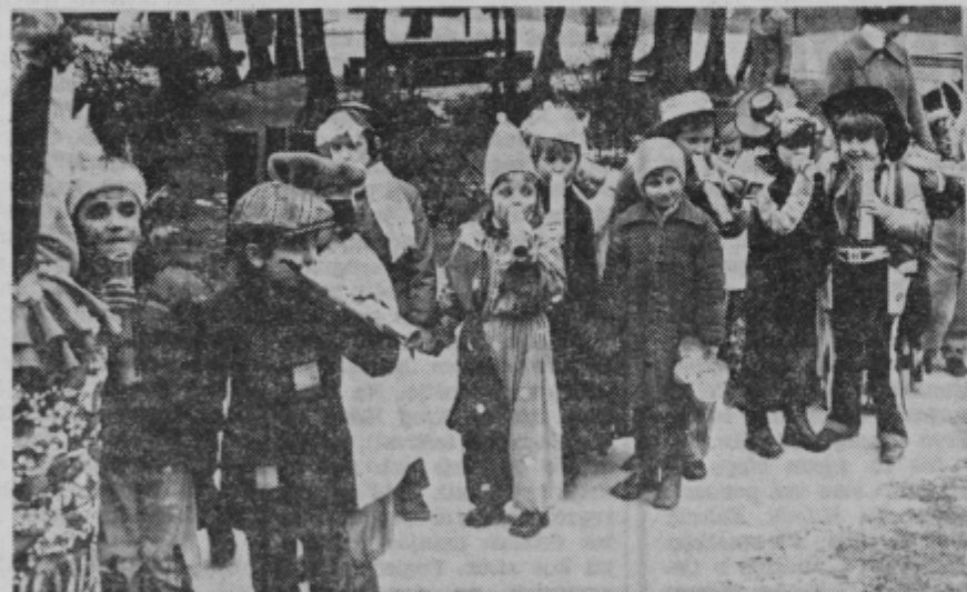
Celje. Pustni torek. Mrzlo in pusto jutro. Le tu in tam kakšna maska. Pa še ta, kot bi se sramovala dneva norčij. Vse mrzlo, nobene živahnosti. Smo mar pozabili na pusta, na veselje, prijetno razpoloženje?