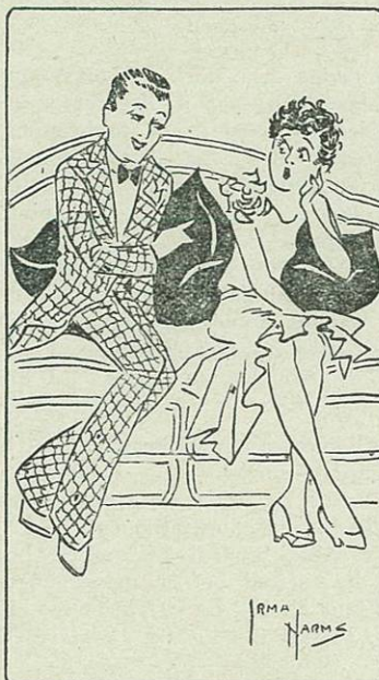
"There's not much stirring when a girl refuses to spoon."