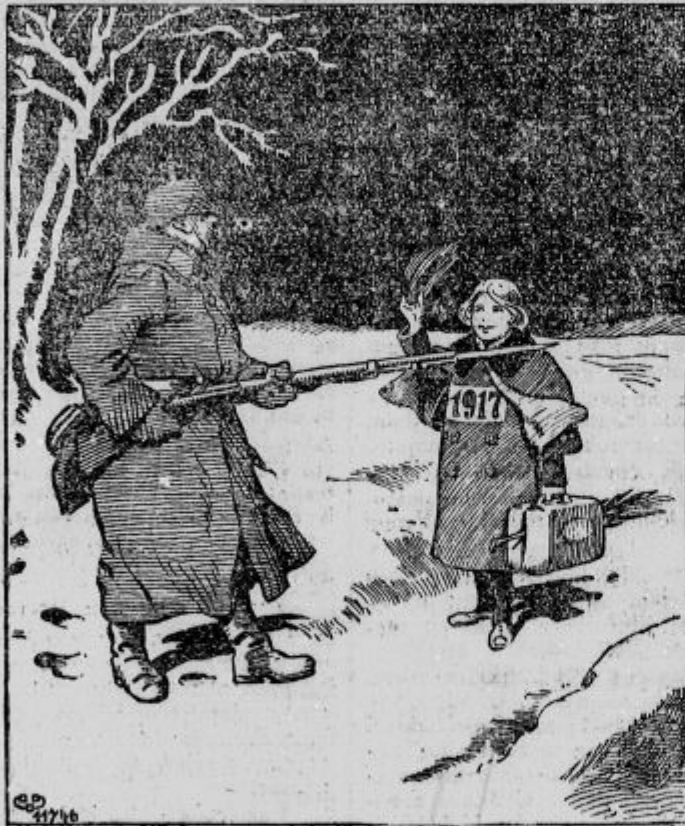
»Stojl Kdo tu? — Bojni klic?« — Mir.

Tudi Slovence smo tukaj. Ker v zastopstvu Koroške dežele o priliki poklonitve novemu cesarju ni bilo nobenega Slovenca, je poslalo »Katol. politično in gospodarsko društvo za Slovence na Koroškem« ministrskemu predsedniku Clam-Martinicu v imenu 100.000 koroških Slo-