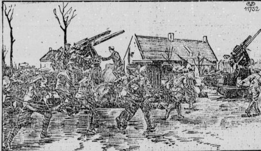
Angleška bramba proti letalcem. — Alarm.

Vojna črna torta. Raztepi rumenjaki na sedmih žlicah mleka, vmešaj še sedem žlic dobre črne kave (kakao ali čokolade), 30 dek sladkorja, žličko sladke skorje in žličko žbic; dalje vzemi malo limonove ali jabolčne lupinice, malo mandeljev, če jih imaš pri roki, sicer je dobro tudi brez njih, vmešaj polagoma še 28 dek črne moke, ob koncu mešanja pa še sneg beljaka in kvasni