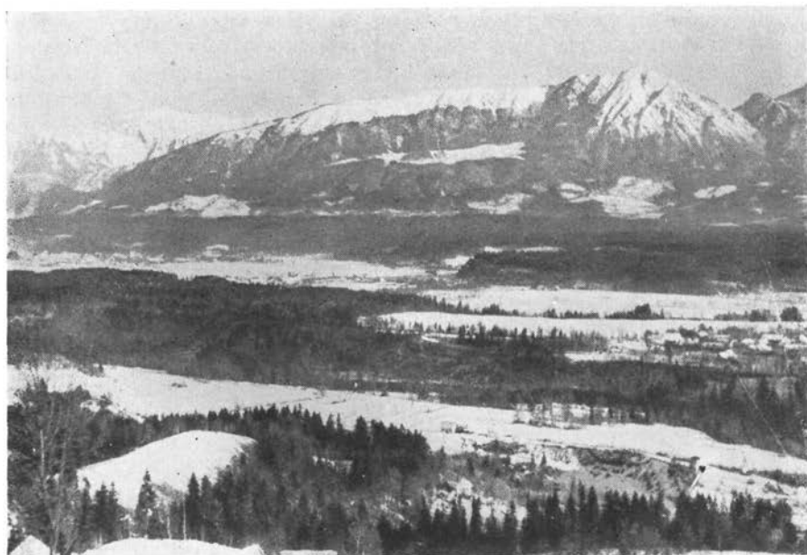
Kriška gora od Sv. Jošta