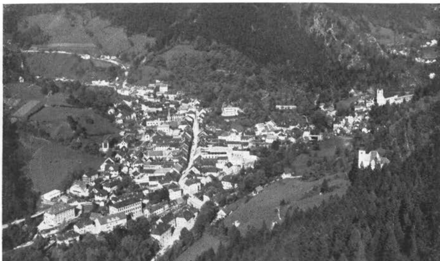
Tržič z Velike Mizice