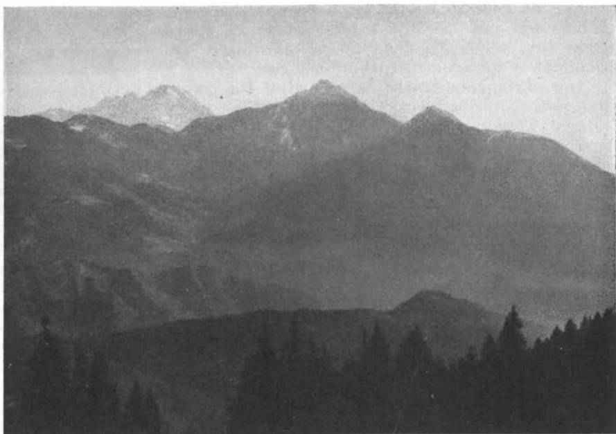
Od desne: Kokornica, Storžič, Grintavci s poti na Dobroč

bila sva namenjena v zapadno smer, da še ta dan, ki se je bil pravkar prevesil, prehodiva dolgi hrbet Kriške gore in se vrneva v Ljubljano.