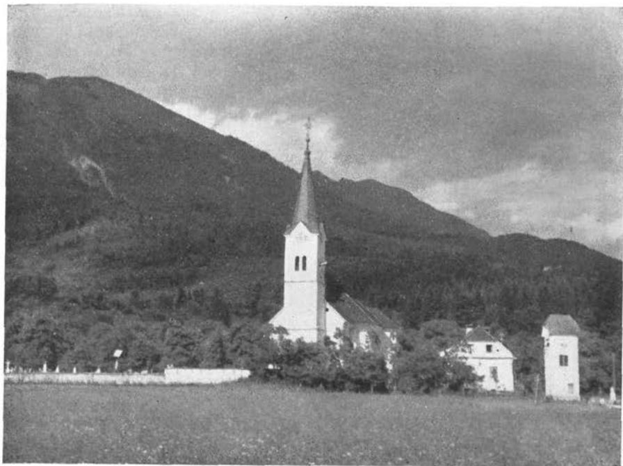
Vas Križe s Kokovnico v ozadju