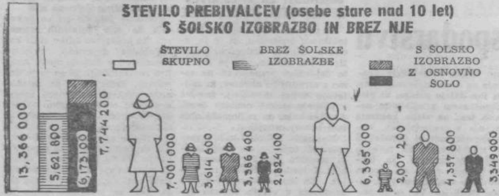
Prebivalstvo po šolski izobrazbi in spolu po popisu z dne 31. marca leta 1953 (v tisočih)