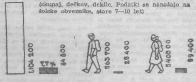
ŠTEVILO ŠOLSKIH OBVEZNIKOV (BELO) ŠTEVILO ŠOLSKIH OBVEZNIKOV, KI NE HODIJO V ŠOLO (ČRNO) (skupaj, dečkov, deklic, Podatki se nanašajo na šolske obveznike, stare 7-10 let)

Lahko pribijemo, da je neprekinjeni vir novih nepismenih v najmlajših letnikih, kar je zlasti zaskrbljujoče. Iz celotne slike nepismenosti in neizpolnjevanja šolske obveznosti pa izhaja še drugi zaključek, ki nas sili, da uporabimo najodločnejše ukrepe glede izpolnjevanja šolske obveznosti in da na stalen in sistematičen način organiziramo borbo proti nepismenosti.