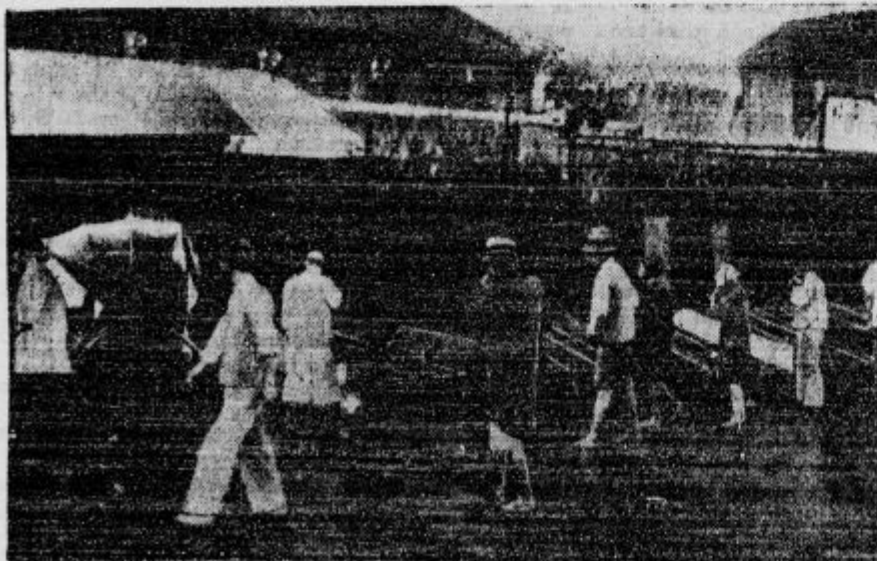
Krste s številnimi žrtvami japonskih zračnih napadov so v kitajskem Šangaju javno razstavljene, da morejo svojci poiskati svoje mrtve.

d V boštajnski graščini je gorelo. V torek 5. oktobra okrog 9. zvečer je v boštajnskem gradu pod Grosupljem, last barona Lazzarinija,