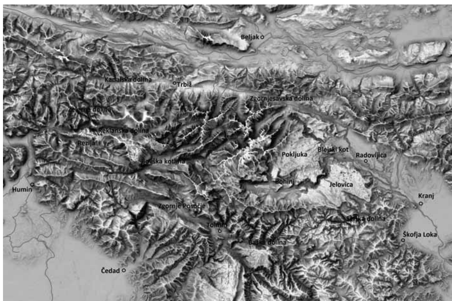
Zemljevid 1. Julijske Alpe z glavnimi naselbinami in geografskimi področji.