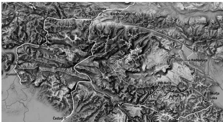
Zemljevid 3. Prometne povezave na območju Julijskih Alp v srednjem veku.

Iz 16. stoletja je ohranjena mitninska knjiga baške mitnice za leto 1536, ki je stala na lokaciji današnjega naselja Most na Soči, in je nastala po letu 1509 ter nadomestila patriarhovi poznosrednjeveški mitnici v Cerknem in Koritnici. Skozi baško mitnico je tekел promet iz Kranjske v Furlanijo in obratno, tako skozi Poljansko kot Selško dolino ter tudi iz Bohinjja. Leta 1536 je zabeleženih 1200 tovorov vina, železnih izdelkov, platna, olja itd., 1176 volov, 127 konjev ter okrog 400 glav drobnice in svinj. Po tej podalpski poti je potekala predvsem kmečka trgovina na srednje razdalje, večino blaga so tovorili podložniki loškega gospostva. Dohodek mitnice je znašal 80 goldinarjev, kar kaže na to, da je bila tedaj cesta že manj prometna, kot je bila verjetno v 14. ter še v 15. stoletju. Podobno je bilo tudi z mestom Čedad, ki je najbolj cvetoča leta svoje zgodovine prav tako že imelo za seboj. 230